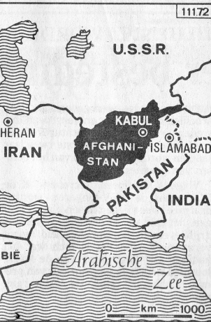
Afgaanse verzetsrijders kijken angstig omhoog naar Sovjet-straaljagers.

Russen moeten weg uit Afghanistan. Dat heeft de hoogste prioriteit. Zij weten het, wij weten het, iedereen weet het."