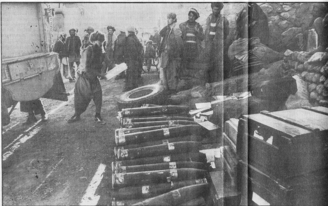
Het kaartje hierboven geeft de route van de mujahedin aan. Op de foto hier naast: Afghaanse verzetsstrijders laden wapens en ammunitie over uit een vrachtwagen. Hun tocht zal met paarden en ezels verder gaan.