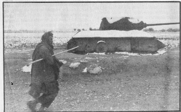
Een gedemonteerde Sovjet-tank in het veld bij het stadje Dahaha-I-Ghuri.