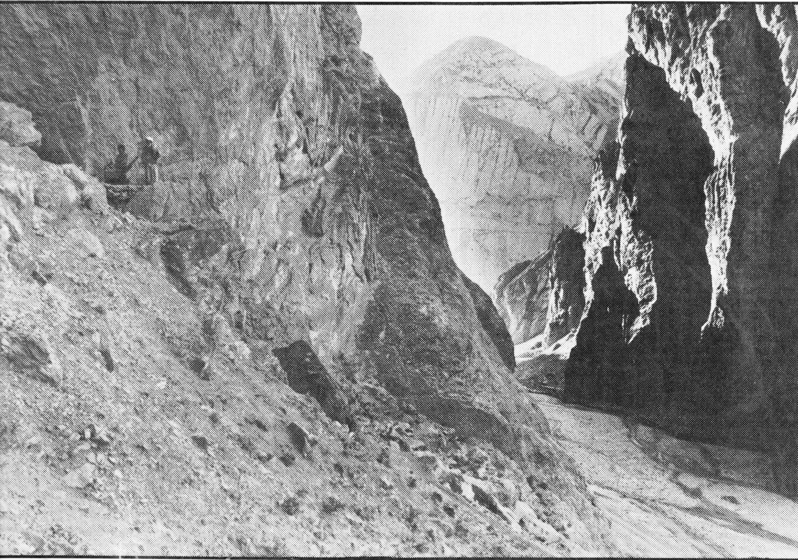
...aar gewapende Afghaanse verzetsstrijders grendelen de toegang tot een vallei af in de provincie Samangan.