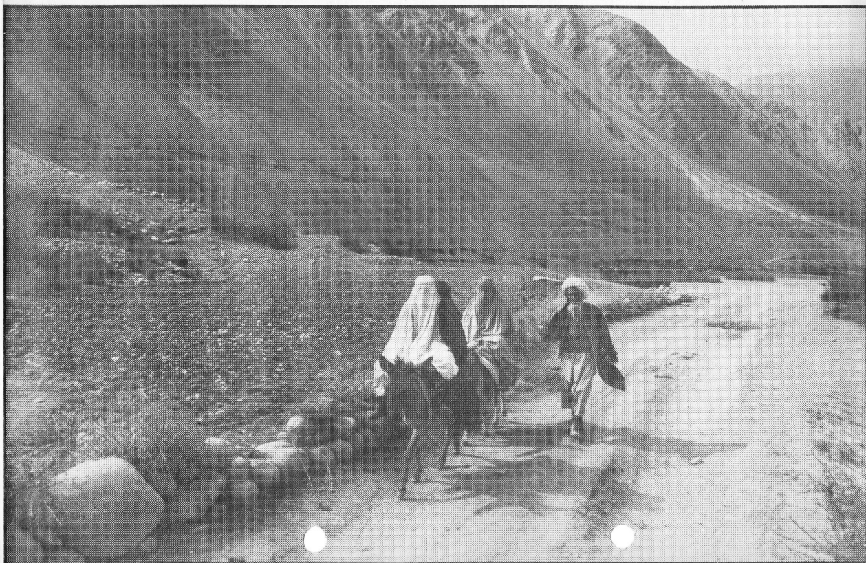
Afghaanse vrouwen dragen, zodra ze hun huis verlaten, de traditionele sluier.