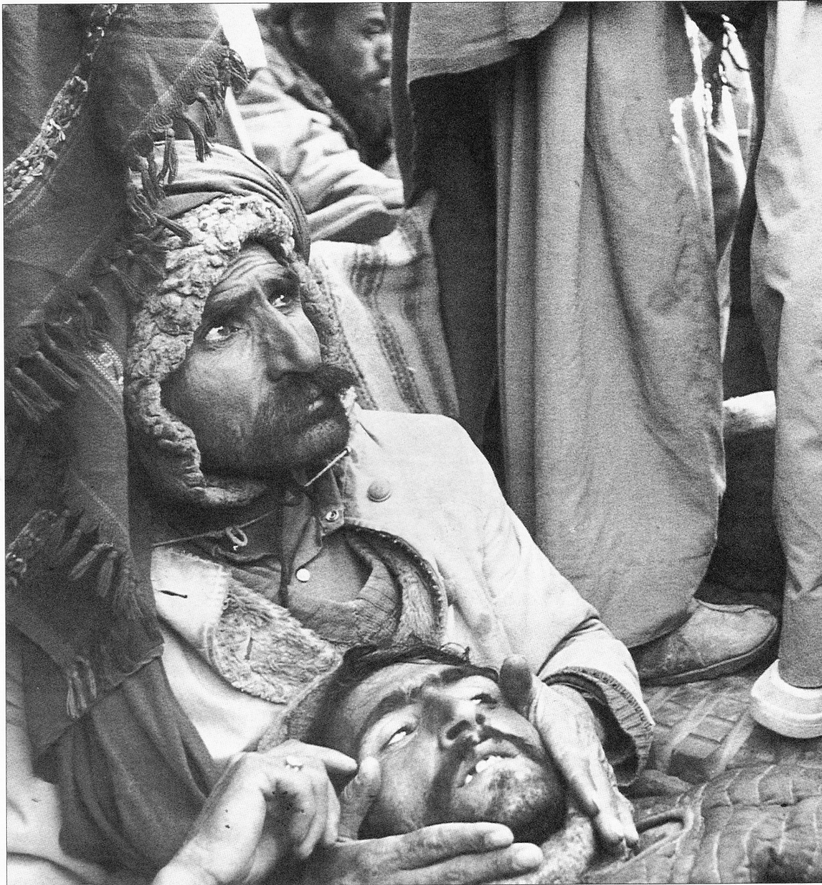
Afgaanse vluchtelingen, op weg naar Pakistan, zien Russische gevechtsvliegtuigen overkomen, november 1988.