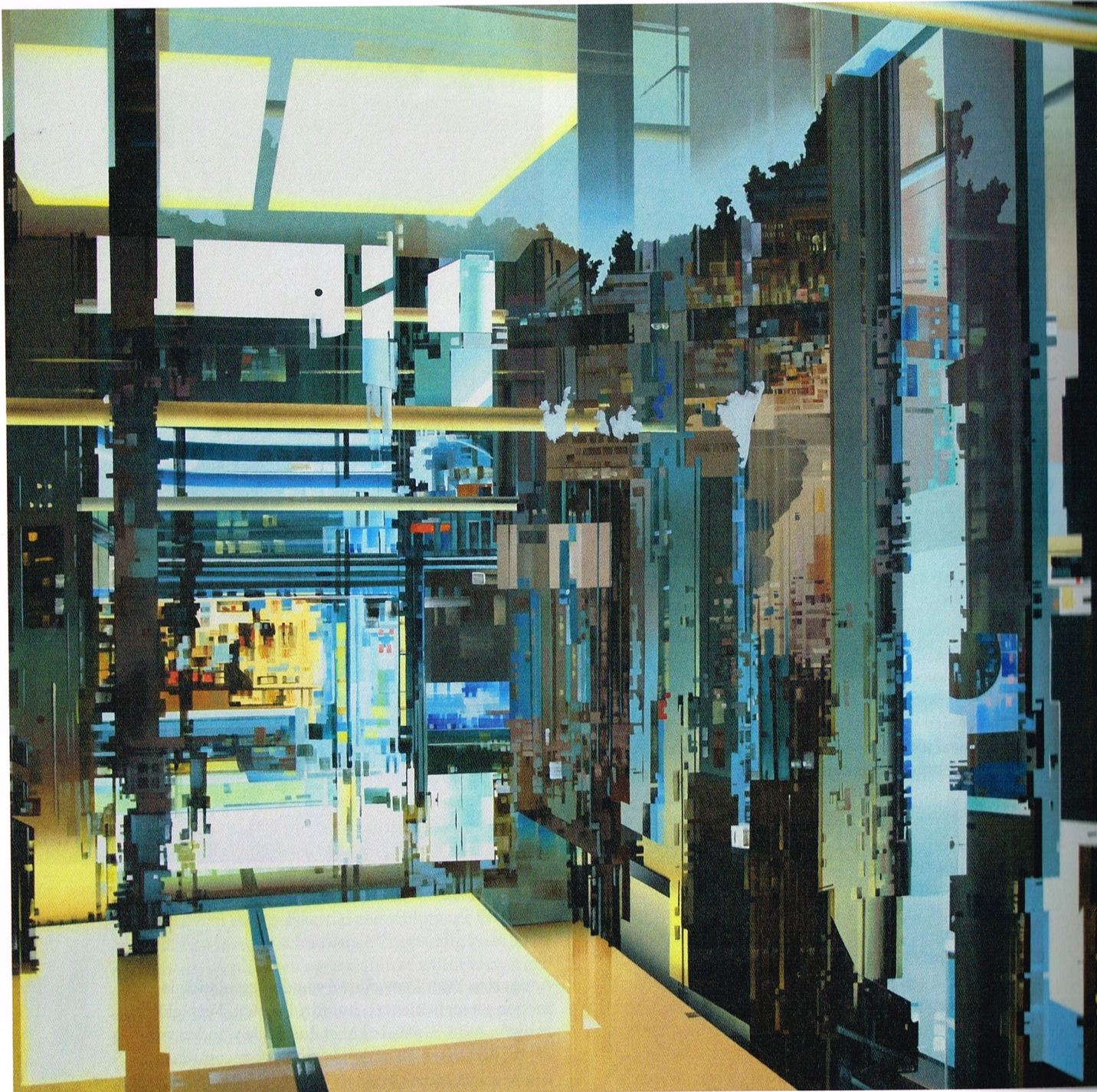
Kobe De Peuter The Forest, 2015

In deze stelling volg ik hem niet meteen, om eerlijk te zijn: “Het ideaalbeeld van de mens is niet meer menselijk”. Wanneer dit beeld vanuit het orgaan komt dat ons uiteindelijk definieert als mens, de hersenen, kan