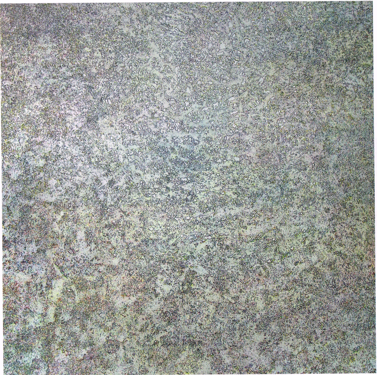
Anouk Van Offenwert Pa's Bloem serie, 2021