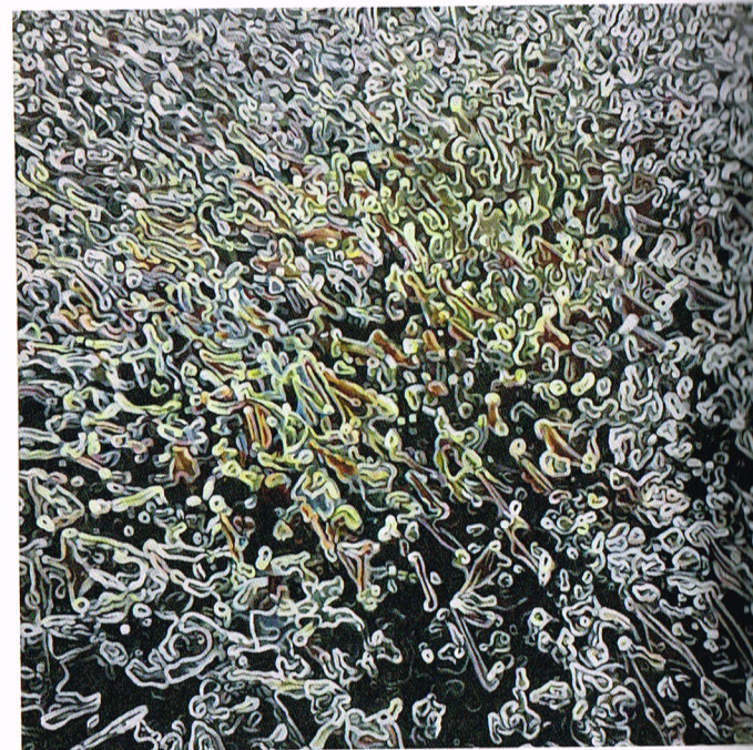
Kobe De Peuter Organism , 2019

Ruimte krijgt een centrale plaats in zijn reeks The Stage . Al zet hij hierin het concept ruimte naar zijn eigen hand. Verschillende dimensies lijken er te overlappen en zodanig in elkaar verwrongen dat ze een nieuwe vormen. Hoewel deze ruimtes vertrouwd aanvoelen lijken het eerder hallucinaties van een potentiële ruimte. Het is niet meer de geportretteerde die gedoriënteerd in de ruimte vertoeft, het is de kijker die meegevoerd wordt in deze nieuwe werelden.