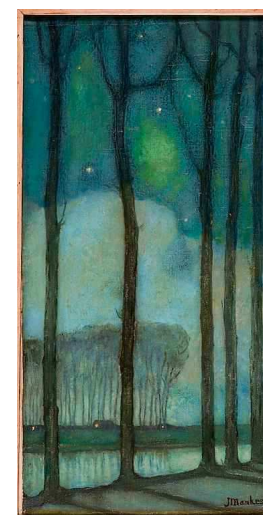
Links: Simon Kamminga - Landschap Rechts: Jan Mankes - Maanacht bij Woudsterweg