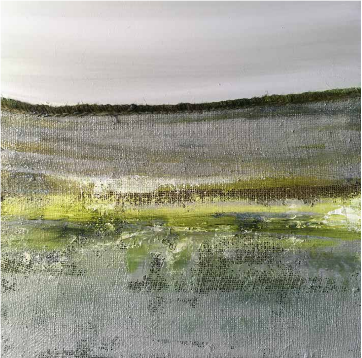
Els Vegter, Polderland I , Olieverf en jute op linnen, 2019

schappen te zien zijn. Ik schilder ze niet letterlijk na, maar ze beïnvloeden me. Op het ogenblik verschijnt in mijn werk vaak een lege achtergrond, een verstilling. Ik laat steeds meer weg.'