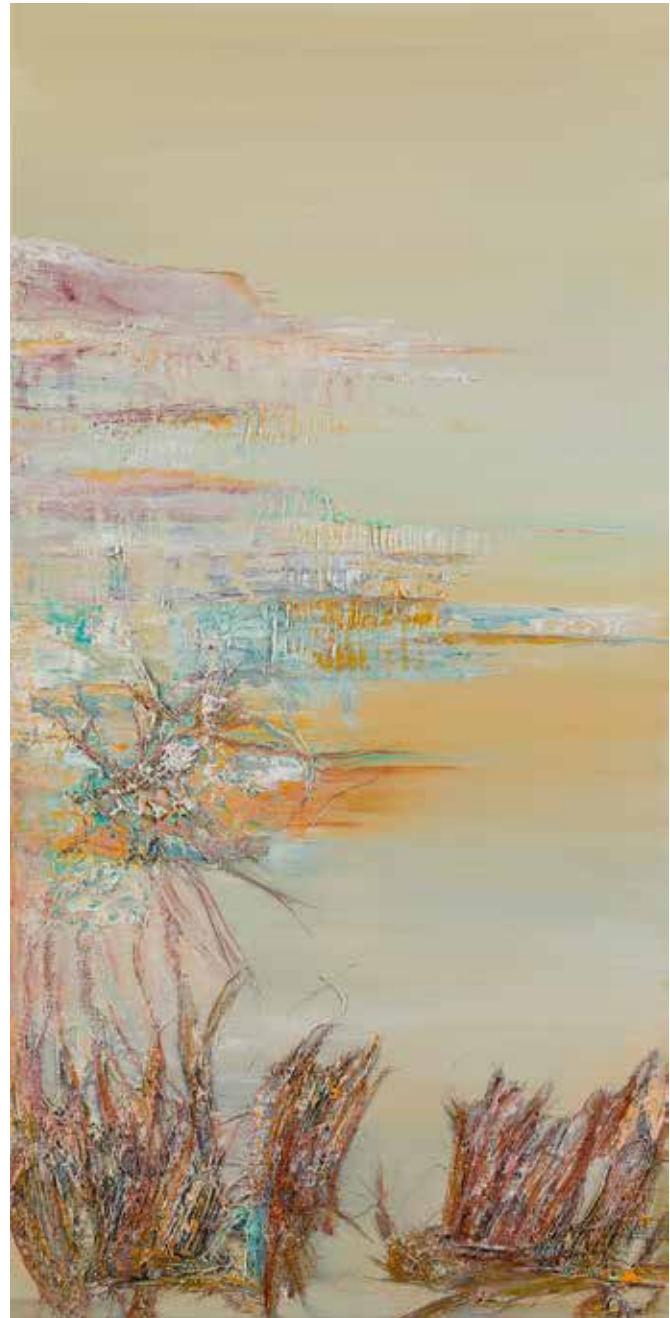
Els Vegter, Vulkanische grond 06 , olieverf en organisch materiaal op linnen, 2018

'Nee, schoonheid in de kunst vind ik niet per se belangrijk, maar ik houd wel erg van schoonheid. In de kunst vind ik het vooral belangrijk dat je geraakt wordt. Dat kan ook door de rauwe kant, door het monumentale, of – omgekeerd – door het kleine. In mijn werk zit altijd een bepaalde balans, het is afgewogen. Ik