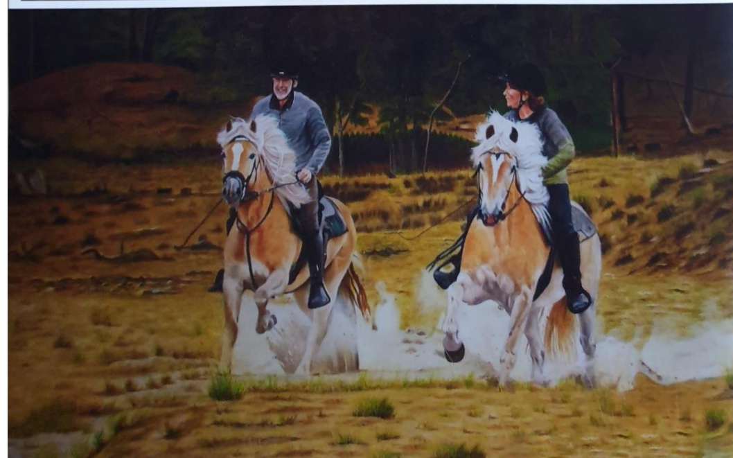
Onder: Twister en Mila onder het zadel (olieverf op paneel, 60x100cm)