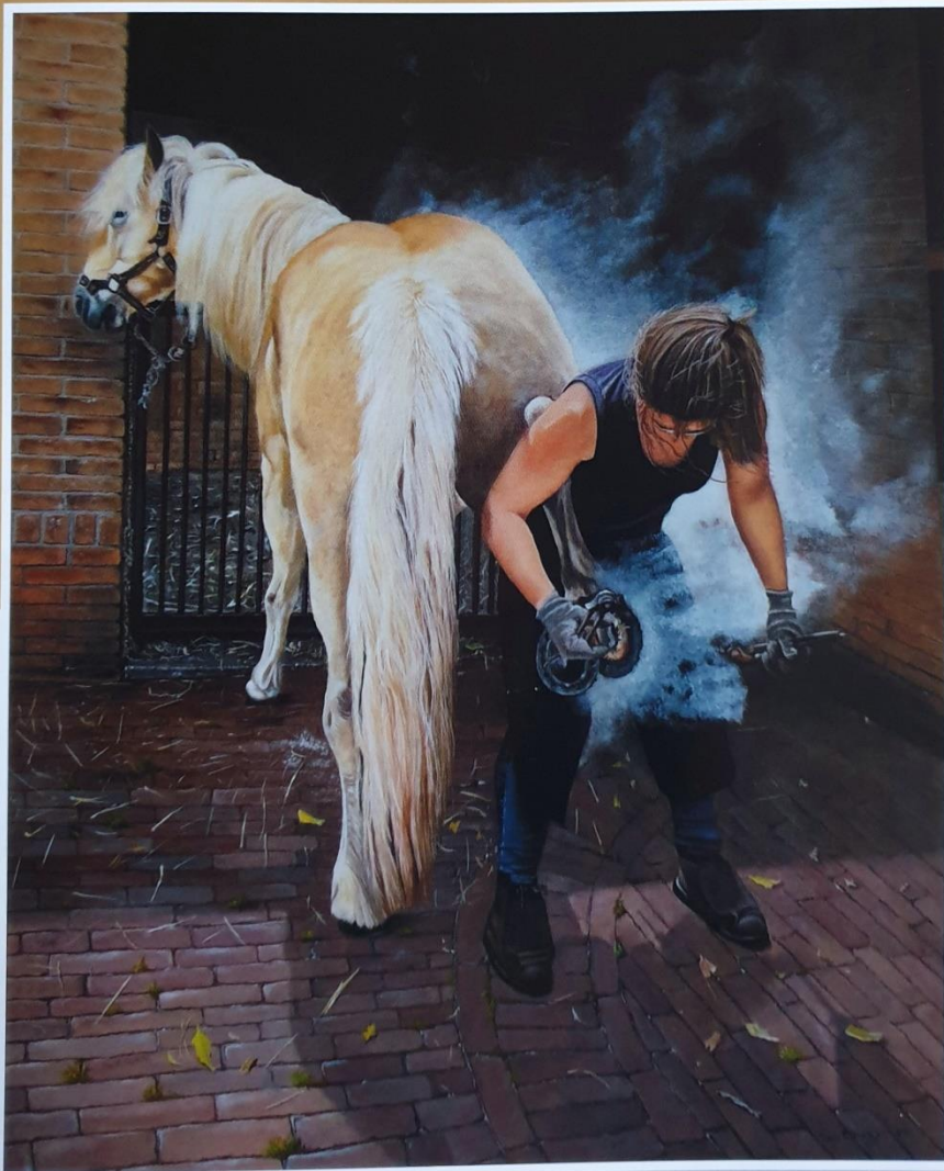
Vierkant beslagen (olieverf op paneel, 60x50cm)