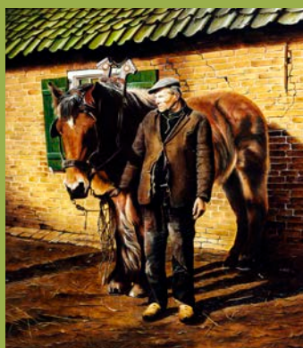
Boer met Belgisch werkpaard, 60 x 50 cm en Ekster, 30 x 40 cm