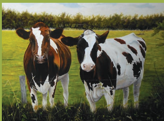
Twee roodbonte kalveren, 70 x 90 cm