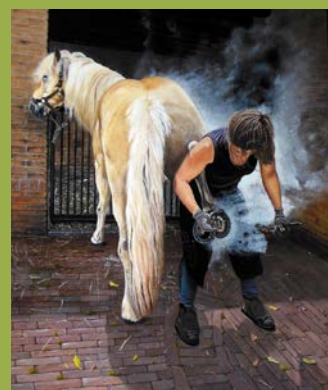
Vierkant beslagen, 60 x 50 cm

In zijn schilderijen – olieverf op paneel – streeft de kunstenaar naar een zo realistisch mogelijke weergave, voornamelijk stillevens geplaatst in een claire obscur-achtige sfeer. Afbeeldingen in zijn schilderijen betreffen vaak voor de hand liggende voorwerpen zoals een oude vaas of plank en fruit of bloemen, deze laatste meestal uit de tuin van de schilder zelf. Ook zijn voorliefde voor dieren, komt in zijn oeuvre duidelijk tot uiting.