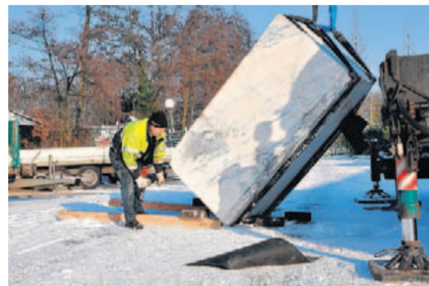
Het 10.000 kilo zwaar wegend stuk rotsblok wordt aangeleverd bij de beeldhouwer Jan-Carel Koster.

de Portugezen, waar er geen gevechten tot de dood van de stier plaatsvinden, heb ik de steen bij hen uit de groeve uitgezocht”, legt de beeldhouwer uit. Verder gaat de sculptuur over tradities en gewoonten, maar ook over de Spaanse historie. “Een belangrijk detail zijn de 12 druiven. Deze worden tijdens de laatste 12 klokslagen van het jaar traditiegetrouw door de Spanjaarden gegeten. Deze traditie brengt hen geluk en voorspoed in het nieuwe jaar. Dit is een traditie die goed past in een Multiculturele wijk als de Hoofdstedenbuurt te Vlaardingen”, vindt Koster. “Het zou mooi zijn dat dit wordt overgenomen door de bewoners van die betreffende wijk om gezamenlijk in elk komende jaar een goede start te maken.” Het is mogelijk om de vorderingen via een blog van de kunstenaar te volgen: www.jancarelkoster.wordpress.com