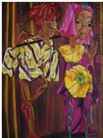
De Fluitist door Berthilde Bouman

"Trio" laat twee marionetten zien. Wie aan trio denkt, weet dat er drie personen worden bedoeld. Eentje mist er duidelijk in dit schilderij. En, dat wilde ik subtiel in dit doek overbrengen. Gelukkig is er nog altijd de liefde. En "de fluitist" heb ik opnieuw in een rustiger schilderij gegoten, met rustiger kleuren.