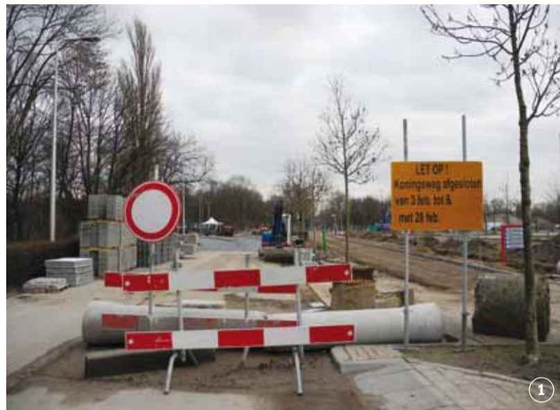
Esther Heinsman OOSTERSTRAAT

De Oostkrant van juni 2012 beschreef de Uithoflijn. Deze tram vanaf 2018 van station Utrecht Centraal, via het nieuwe station Vaartsche Rijn, naar de Uithof rijden. Inmiddels zijn we bijna twee jaar verder en vragen ons af: "Wat is op dit moment de stand van zaken rondom de aanleg van deze tramlijn?"