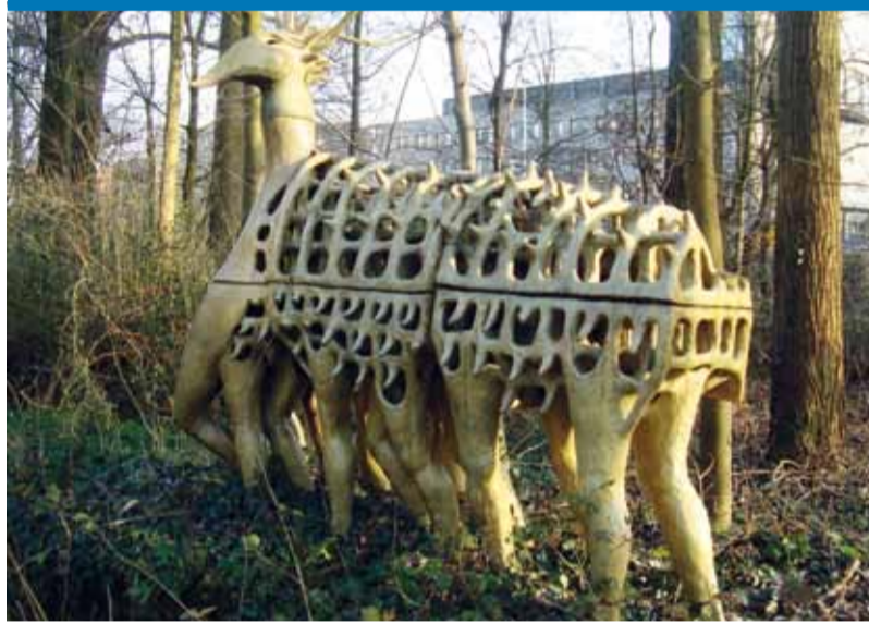
Vlakbij het 'nieuwe' Provinciehuis staat dit fabelachtige keramische kunstwerk Monstre Sacré van beeldhouwer Nicolaas van Os. Het intrigeert vooral door de typische mensenbenen, die klaar staan om in beweging te komen. Foto: Pauline Brenninkmeijer, Mauritsstraat