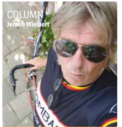
COLUMN Jeroen Wielbert