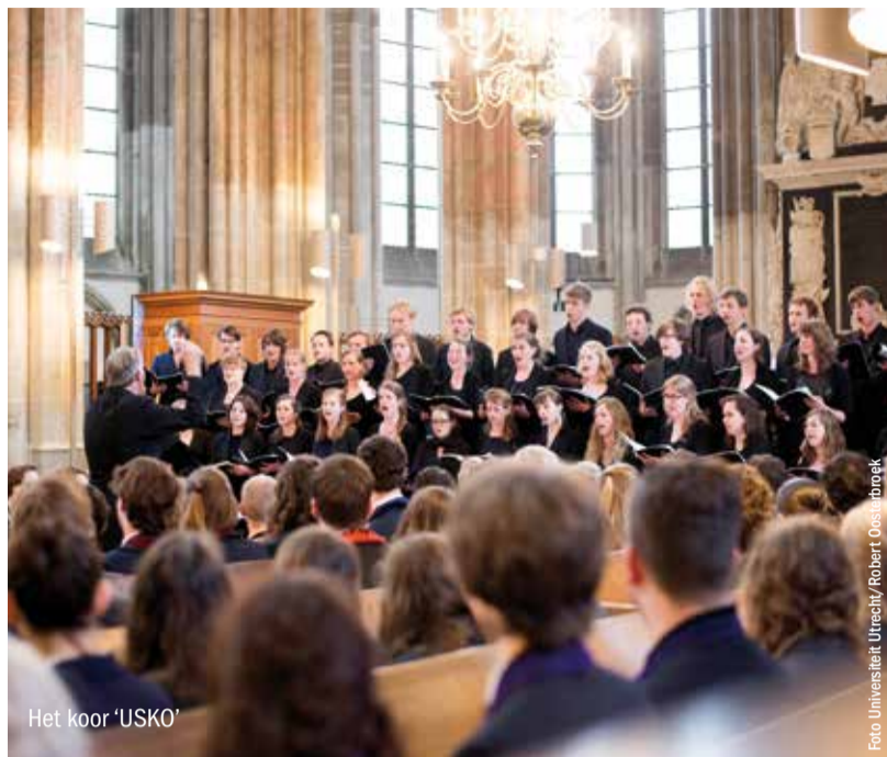
Het koor 'USKO'