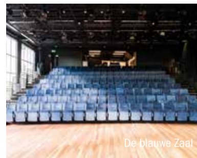
De blauwe Zaal

een deel van de schouwburg dicht voor een renovatie die in fasen plaatsvindt. Na ruim een jaar is nu het eerste deel van de verbouwing afgerond. "We wilden de ruimtes het volume van oudsher teruggeven en tegelijkertijd meer licht creëren", aldus Claus. Meteen bij binnenkomst