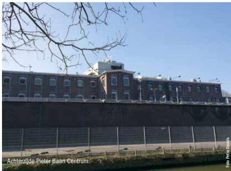
Achterzijde Pieter Baan Centrum

De gemoederen lopen hoog op wanneer het om de opvang van asielzoekers gaat. Voor- en tegenstanders staan lijnrecht tegenover elkaar. Ondertussen komen er nog steeds veel asielzoekers naar Nederland. Vanaf 2019 wordt het oude Pieter Baan Centrum aan de Gansstraat mogelijk een opvanglocatie voor vluchtelingen. De gemeente Utrecht heeft besloten dit tweede asielzoekerscentrum (azc) te openen. Het Centraal Orgaan opvang asielzoekers (COA) helpt hierbij. Maar waarom is voor deze plek gekozen? En wat betekent dit precies voor de burens?