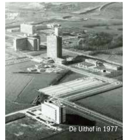
De Uithof in 1977

De Oostkrant introduceert een nieuwe rubriek: Toen & Nu. Hierin zoomen we in op een plekje in Oost: wat zien we er nu en wat stond er vroeger? Abstederdijk 301 bijt op pagina 2 het spits af. De Universiteit Utrecht viert dit jaar haar 380e verjaardag. In de jaren zestig opende de faculteit Diergeneeskunde als eerste haar deuren op De Uithof. Tegenwoordig studeren en werken duizenden mensen op het Utrecht Science Park. We blikken terug op een stukje geschiedenis van dit deel van Oost. En u wilt vast ook weten hoe het met de mooie oude beuk bij het Rosarium is. Een update op pagina 4. Lees, reageer of geef uw ongezouten mening. We horen het graag van de mensen uit Oost! redactie@oostkrant.com Kijk ook op www.oostkrant.com