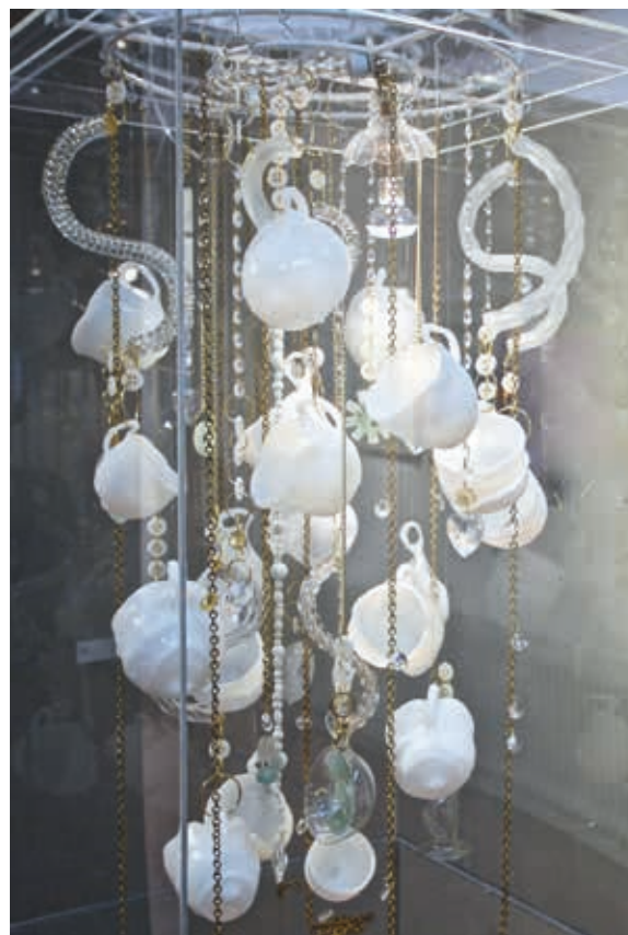
Ans Bakker, Kroonluchter Op de Liefde , 2017; perspex box, slumping pyrexglas, kettingen, kralen, laboglas, glazen knopen, kroonluchterarmen, recycleglas; in box h. 190 x 50 x 50 cm