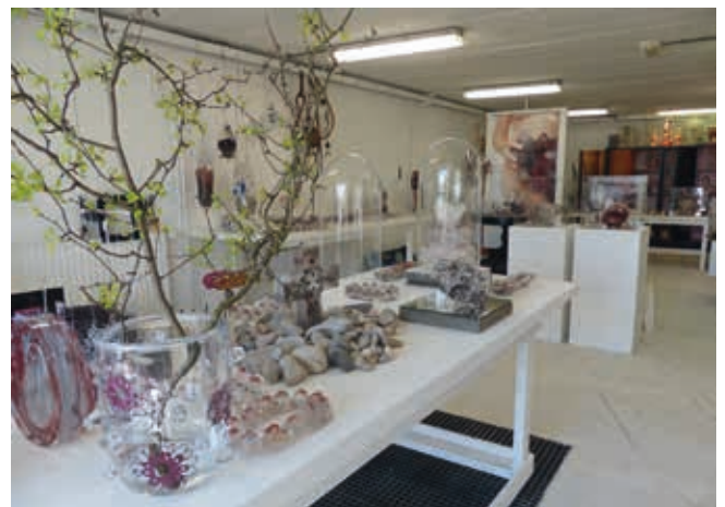
Atelier Ans Bakker, 2014.

bouwen, waarbij de cirkel het uitgangspunt is. Inspiratie vindt ze in de natuur, spirituele beleving, levensprocessen en patronen, waarbij ze verschillende glas technieken inzet: glasblazen en -gieten, pâte de verre, kiln casting en recycleren, graveren, slijpen en zandstralen. Haar eindexamenwerk bij het IKA in 2015 bestond uit verschillende werken die meerdere kanten van haar interesse, maar ook van haar zelf lieten zien.