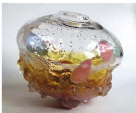
Boven: Ans Bakker, Zeeuws Licht 1 ; 2017; geblazen glas, Oosterschelde-zand, koper, oesterschelpen; h. 30 cm, Ø 35 cm