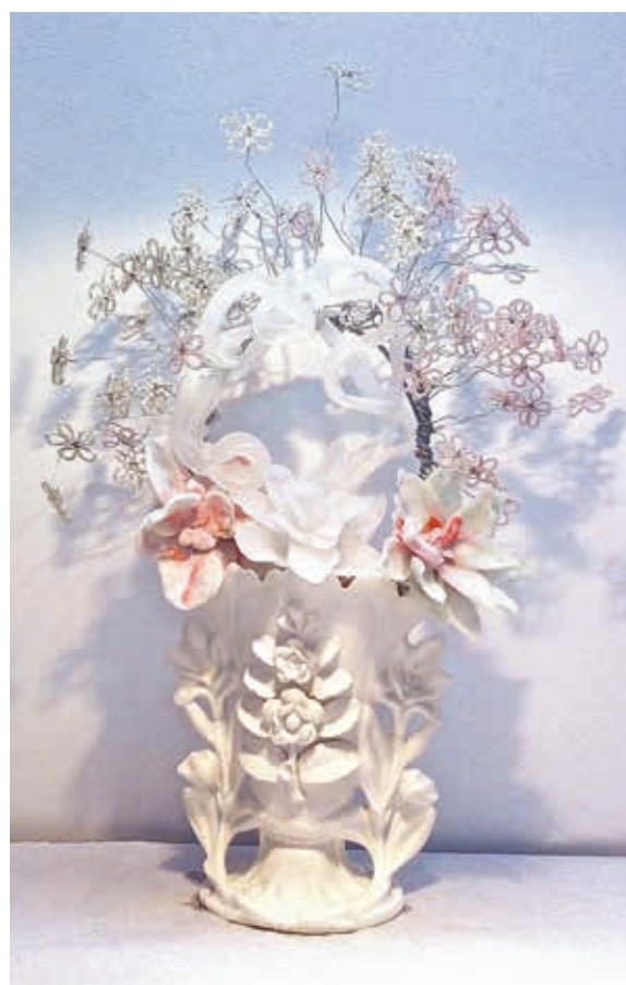
Ans Bakker, Bloemen plukken, Sterren tellen , 2018; glazen bloemen en meer, mixed media (vintage porselein vaas), ijzerdraad, glaskralen; h. 40 x 25 x 20 cm