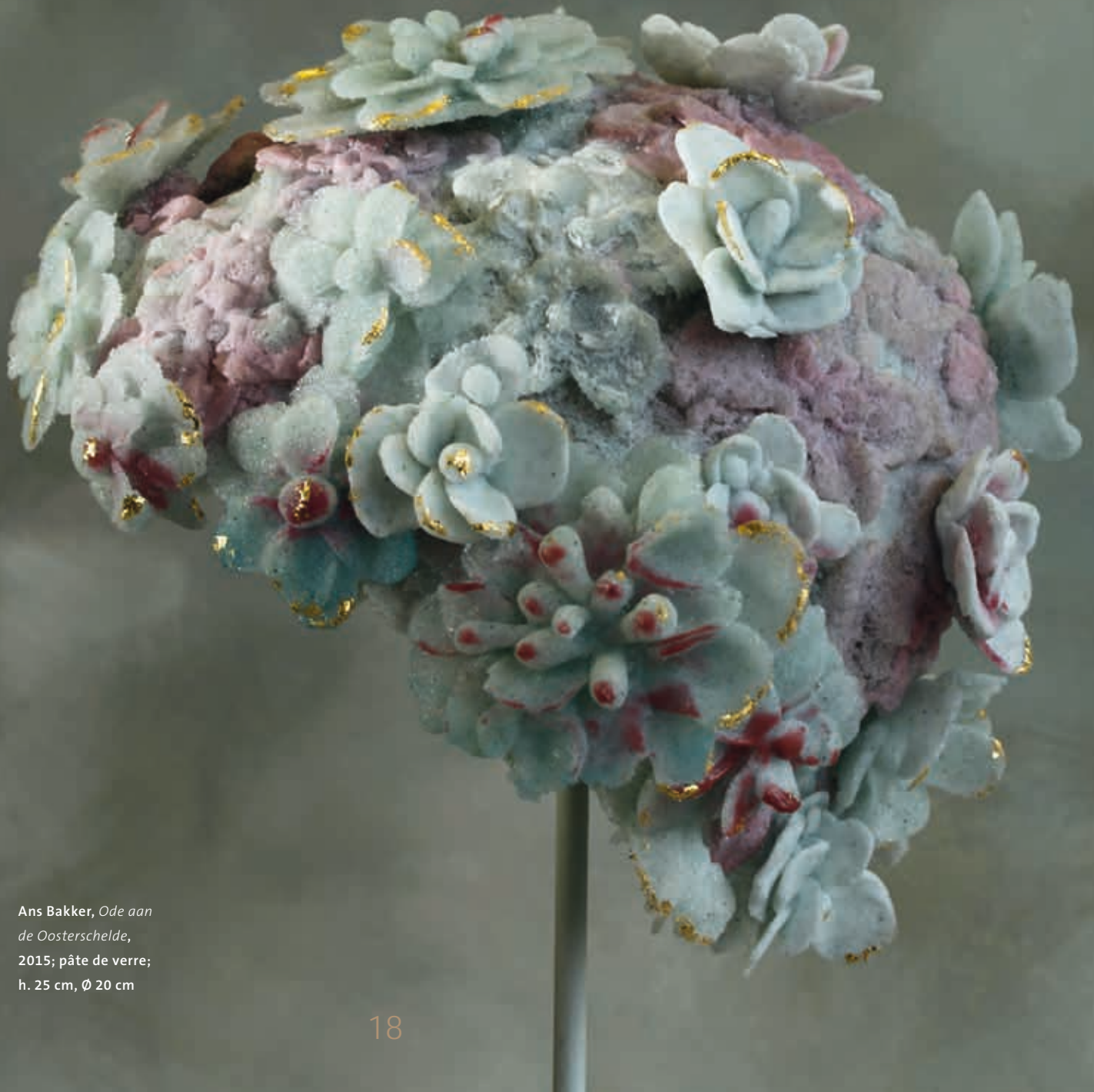
Ans Bakker, Ode aan de Oosterschelde , 2015; pâte de verre; h. 25 cm, Ø 20 cm