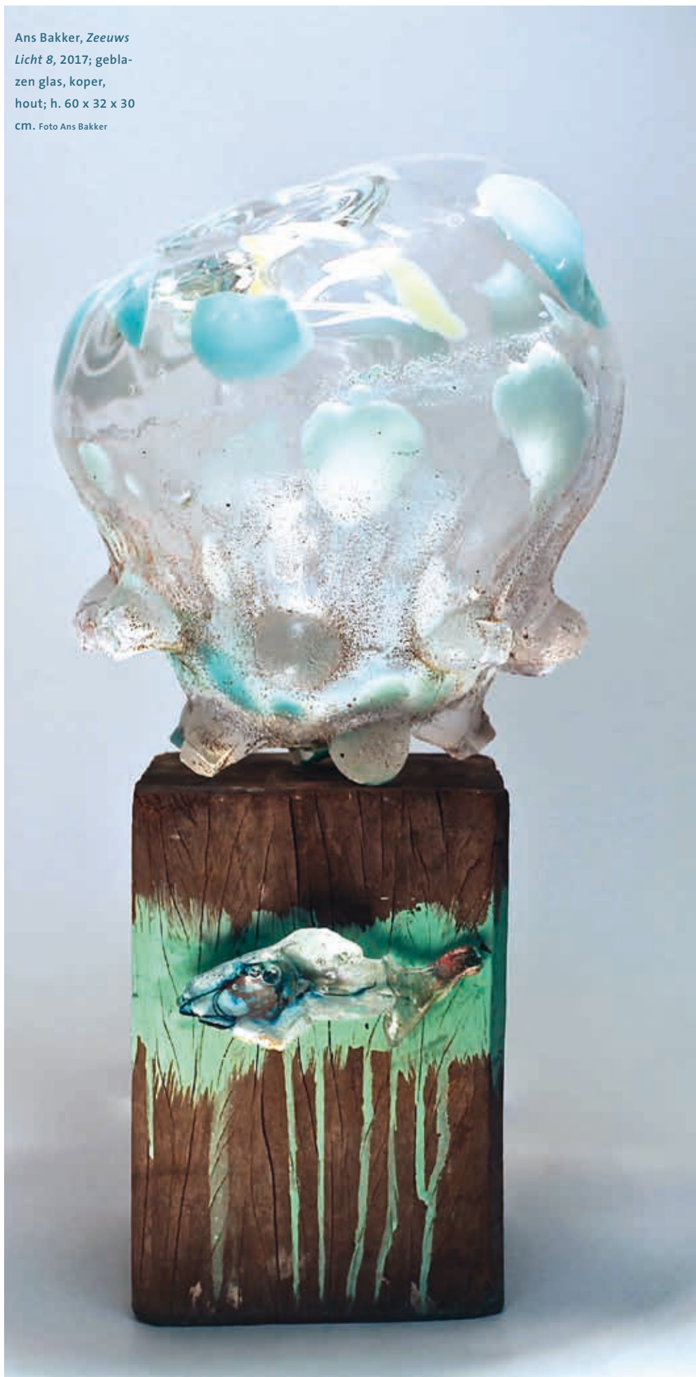
Ans Bakker, Zeeuws Licht 8 , 2017; geblazen glas, koper, hout; h. 60 x 32 x 30 cm.

Zeeuws Licht (2017) is een serie objecten die het verlangen naar een nieuw landschap, het terrein tussen hemel en aarde, vormen. “Het is de kleur die me bezighoudt en het licht van de beweging. Gewoon wat er voor me verschijnt, ik zoek er niet naar. Het nestelen in de aarde, het vuur, het water en schaamteloos herboren worden. En altijd weer zoeken naar dat licht en dat diepe verlangen het nog eens zo te doen. Maar het zou geen