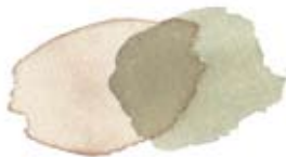
Koffie, alazarine Crimson en ultramarijnblauw.