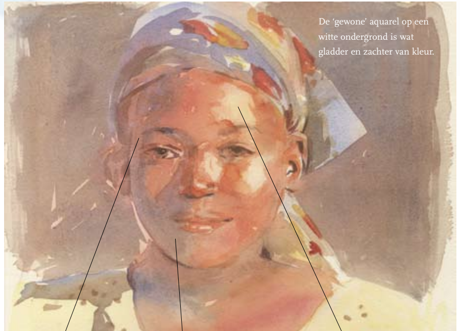
De 'gewone' aquarel op een witte ondergrond is wat gladder en zachter van kleur.