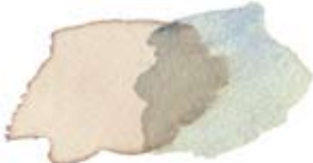
Koffie, cadmium Lemon en ultramarijnblauw.