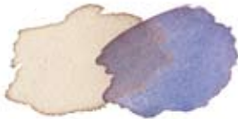
Koffie, cadmium Lemon en ivoorzwart.