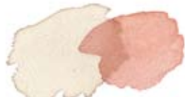
Koffie, cadmium Lemon en Alazarine Crimson.