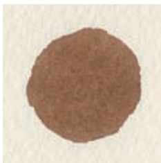
Groenbruine ogen pupil: gebrande omber en gele oker.

van de iris. Deze donkere kleur kan ook voor de bovenste wimperboog worden gebruikt. Afwisselend worden nu tonwaarden en kleuren van de iris en het hele ooggebied opgebouwd.