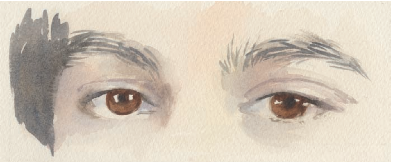
Bruine ogen: huidskleur is hier cadmiumoranje en cadmiumrood licht.