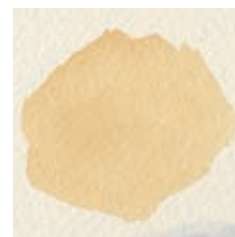
Gele oker en cadmiumoranje.

TV OTTO SCHILLING EEN (TECHNISCHE VRAAG STELLEN OF JE WERK DOOR HEM LATEN JUREREN? KIJK SNEL OP WWW.ATELIERTV.NL