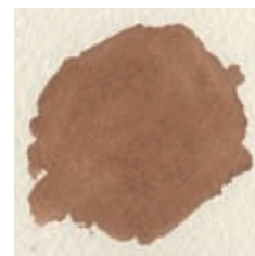
Gebrande omber en gebrande sienna.