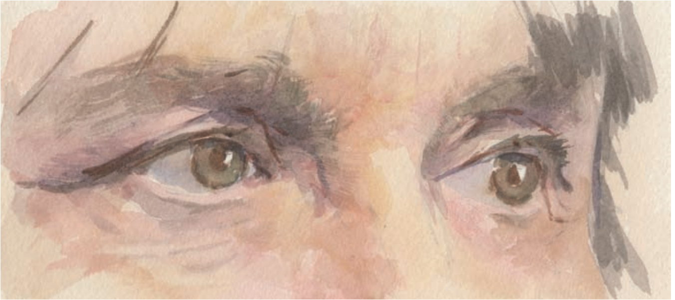
Groenbruine ogen: huidskleur hier is gele oker en alazarine crimson.