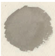
Hookersgroen, alazarine crimson en ultramarijnblauw.