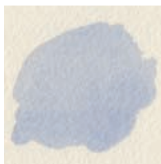
Ultramarijnblauw en cadmiumrood licht.