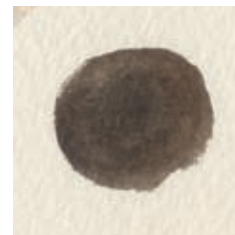
Bruine ogen pupil: gebrande omber en ivoorzwart.