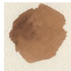
Gebrande omber en cadmiumoranje.