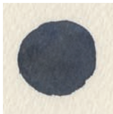
Blauwe ogen pupil: ivoorzwart en ultramarijnblauw.