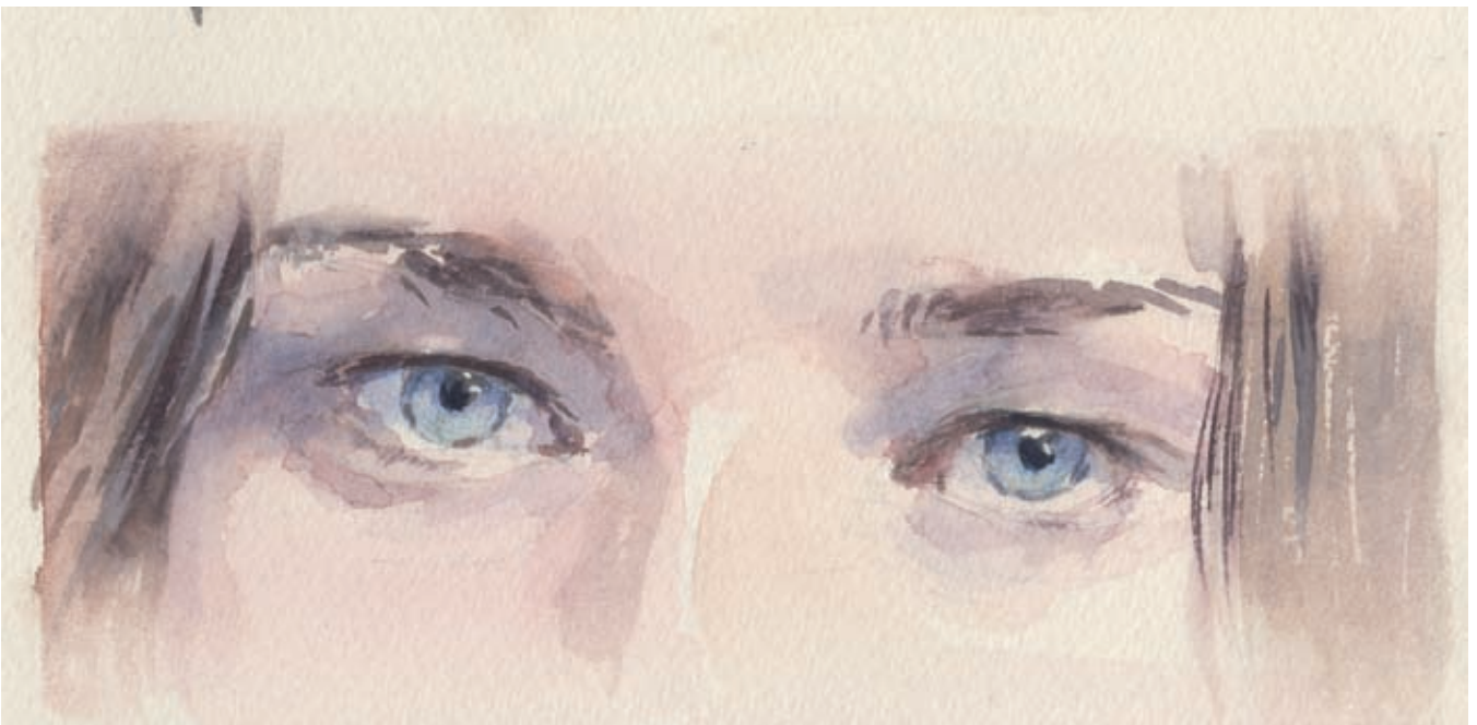
Blauwe ogen: huidskleur hier is Napelsgeel en permanent roze.