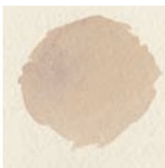
Gele oker, vergrijsd met een mengsel van ultramarijnblauw en alazarine crimson.