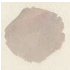
Gele oker, ultramarijnblauw en alazarine crimson.