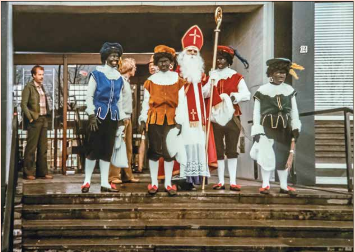
Sint en pieten bij het belastingkantoor.