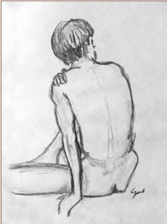
Schets naar model bij Henry de Vries.