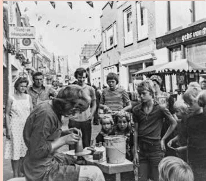
Pottendraaien tijdens de opening van de nieuwe Woldstraatpromenade.

Alle Jeugdland-clubjes verhuisden in januari 1974 naar de ruimtes van het eerste Meppeler wijkcentrum De Poele; wat een luxe! Boetseren bleek toch wel echt mijn ding te zijn en ik kreeg van het bestuur van Jeugdland, samen met Truus Hakman, een cursus pottenbakken op de draaischijf aangeboden bij Het Trefpunt om onze vaardigheden te kunnen gebruiken, om daar later zelf les in te gaan geven. Ik vond het tijdens een aantal Donderdag Meppeldagen erg leuk om in de stad als pottenbakker op de draaischijf mooie vormen uit de klei te toveren.