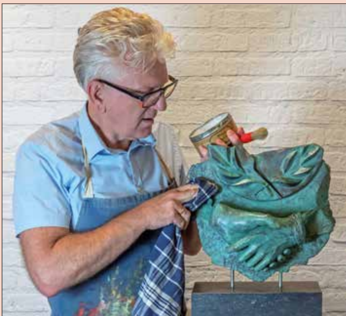
Gert met bronzen beeld Vrede.

ten. Ik was, en ben, zeer geïnspireerd door de marmeren en bronzen beelden uit het oude Rome.