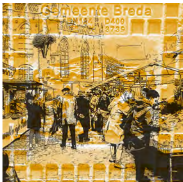
Op de markt