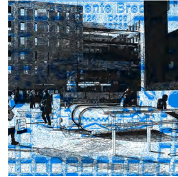
Bij het station