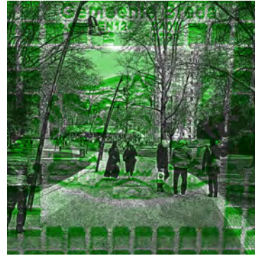
't Huis Breda