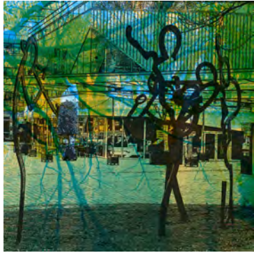
Klein orkest bij het Chassé