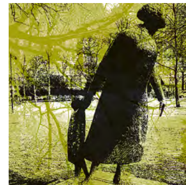
Moeder en kind