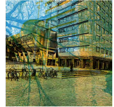
Fietsen voor het Pathé