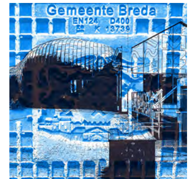
De Mezz Breda