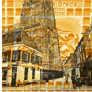
Café De Vrachtwagen