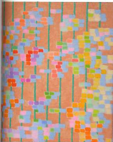
Jaap Hillenius: 'Ruimtelijk', 1988. Olieverf op doek, 40 x 40 cm.

Galerij Blom start het seizoen met werk van de Amsterdamse schilder Jaap Hillenius. Sinds 1990 exposeerde