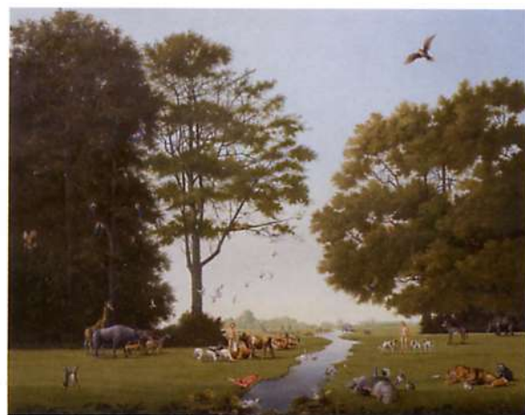
Ab van Overdam en Lux Buurman: 'Het Paradijs'. Olieverf op doek, 120 x 150 cm.

Galerie & Kunstuitleen de Pook Noorderhaven 58 a 7491 AS Delden Tel 074 376 70 65 www.depook.nl 07-09 t/m 26-10