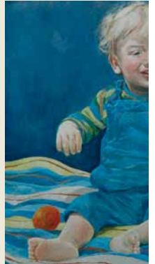
marina 2005 acryl op doek 50 x 50 cm