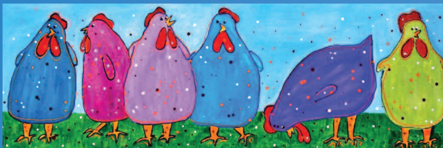
'De Tokkies', acryl op doek, 1,20 x 40 cm, 2015.

"Mijn expressieve vorm van schilderen zorgt ervoor dat ik het onbezorgde, vrolijke van mijn kindertijd weer voel.."