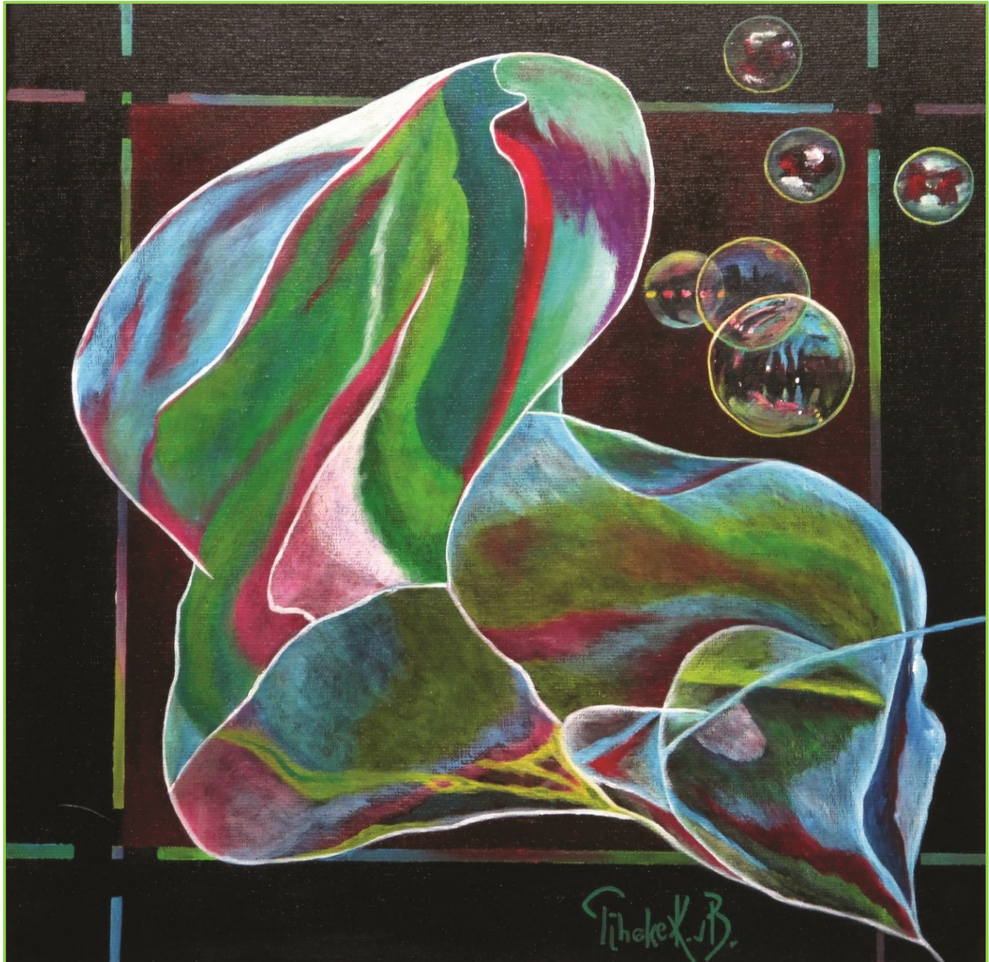
Eurobubbles – 50 x 50 cm – acrylic on canvas – 2016 – Copyright © Tineke K. vB.