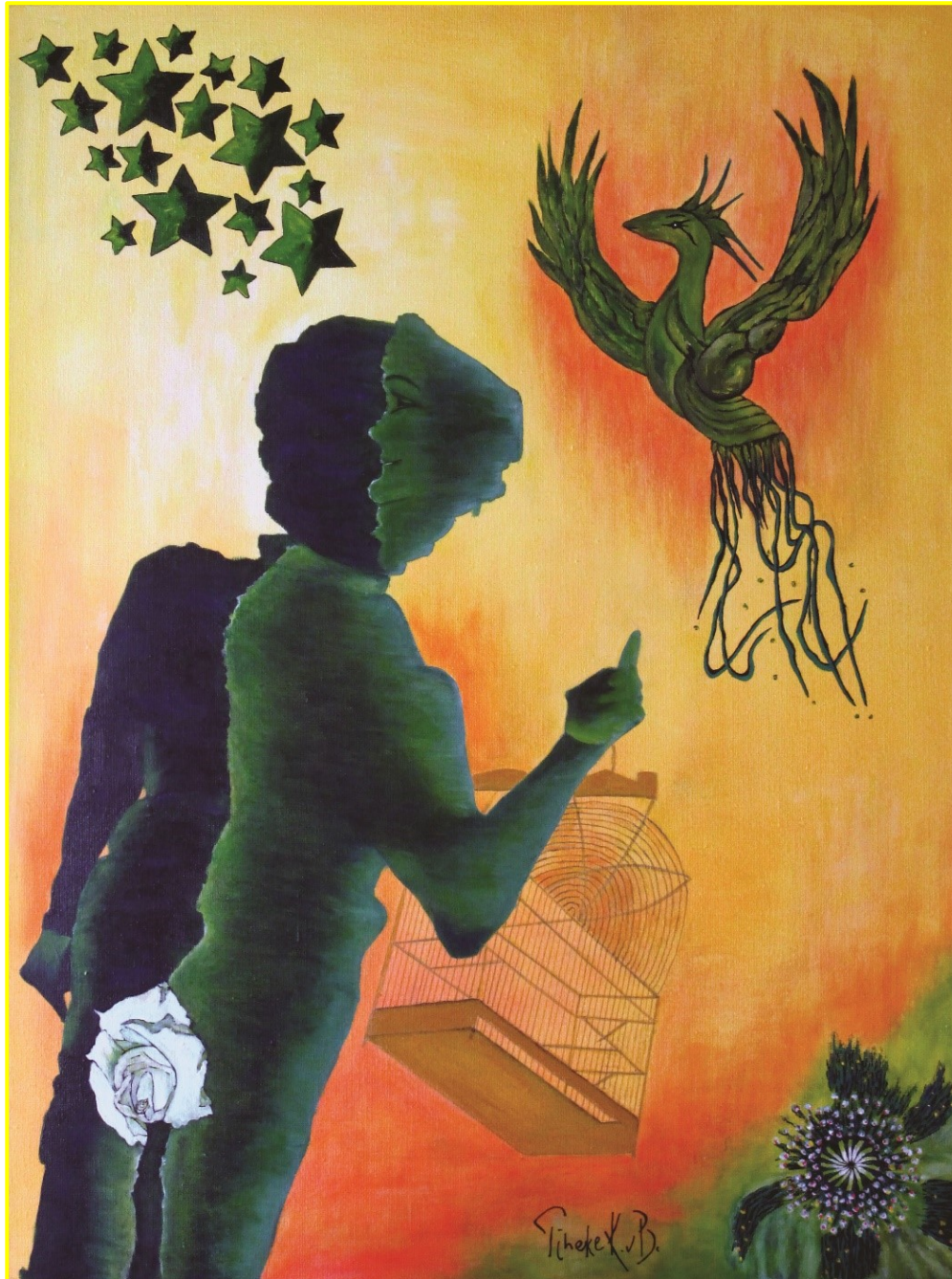
Phénix – “Per ardua ad astra” – 60 x 80 cm – acrylic on canvas – 2017 – Copyright © Tineke K. vB.