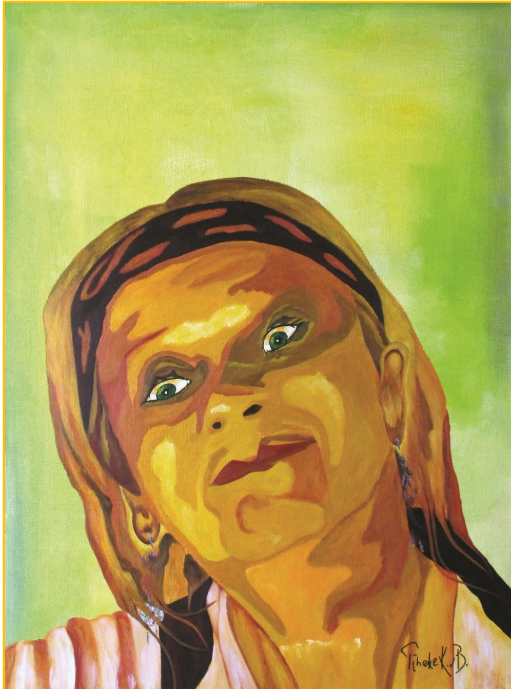
Astonishment – 60 x 80 cm – acrylic on canvas – 2015 – Copyright © Tineke K. vB.