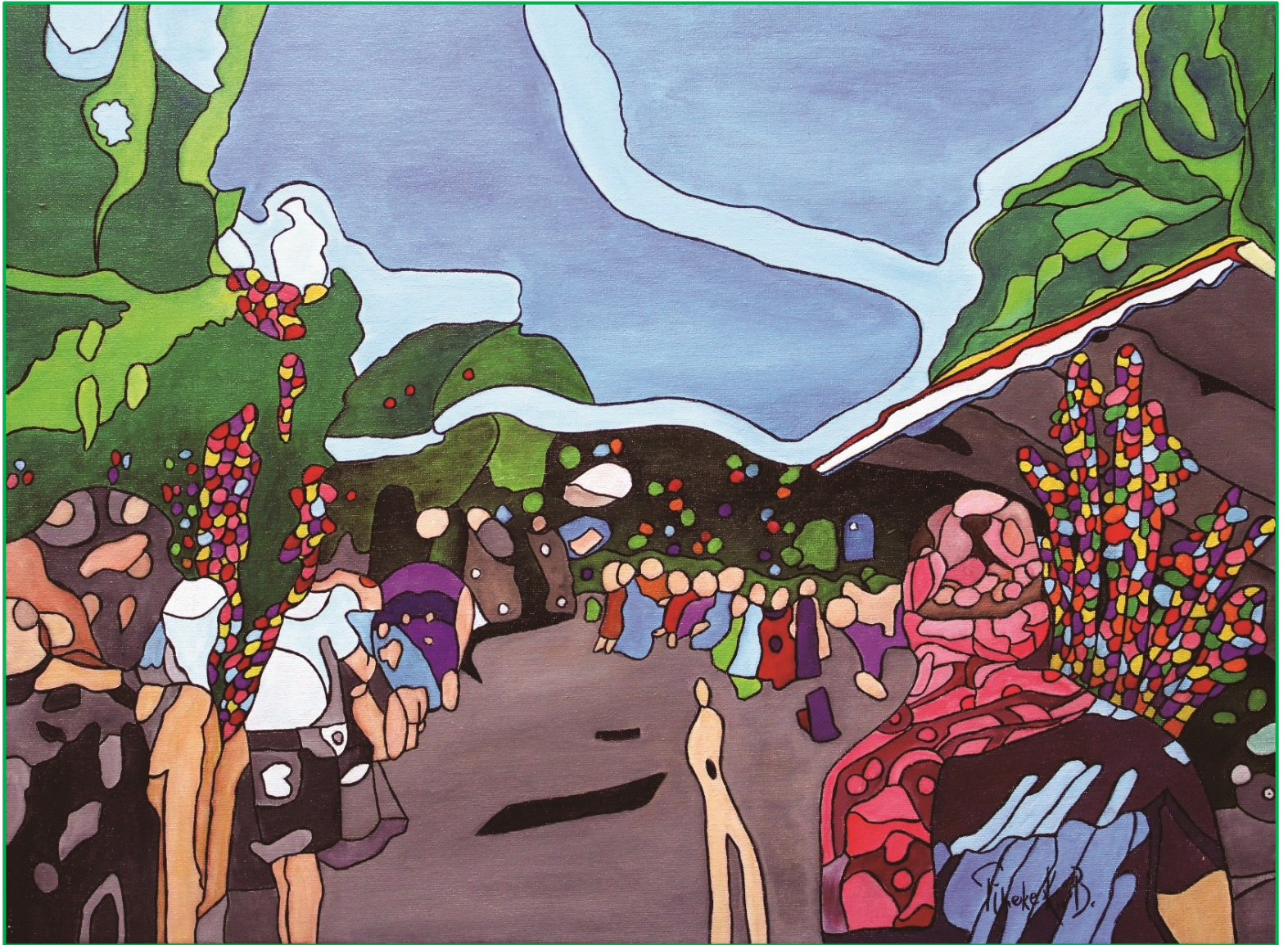
We ..... the people – 80 x 60 cm – acrylic on canvas – 2020 – Copyright © Tineke K. vB.