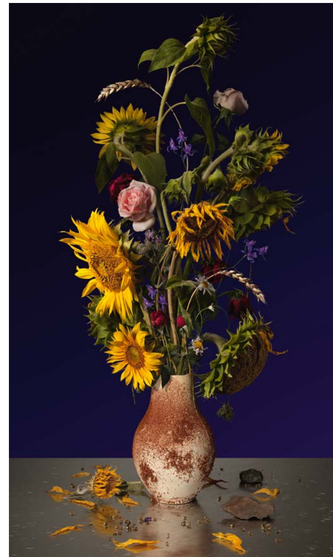
▲ Zonnebloemenboek voor nabestaanden ramp MH 17. Het digitale stilleven is gemaakt van bloemen die geplukt werden op de rampplek. Fotograaf Bas Meeuws is gespecialiseerd in fotografische bloemstillevens.

en transparantie zijn de kenmerken van de nieuwe fotostijl. Foto's lijken soms wel geschilderd uit de illusie van stralend licht. In de geënceneerde wereld balanceren de onderwerpen op de grens van realiteit en fantasie, die even vaak wordt overschreden. Met behulp van het digitale palet smeedt de fotograaf de afzonderlijke afbeeldingen tot een geheel. De beelden geven een andere beleving dan we van de fotografie gewend zijn.