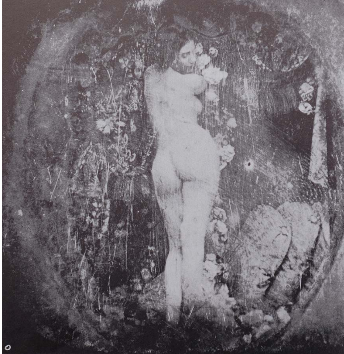
▲ Daguerreotype, circa 1855.