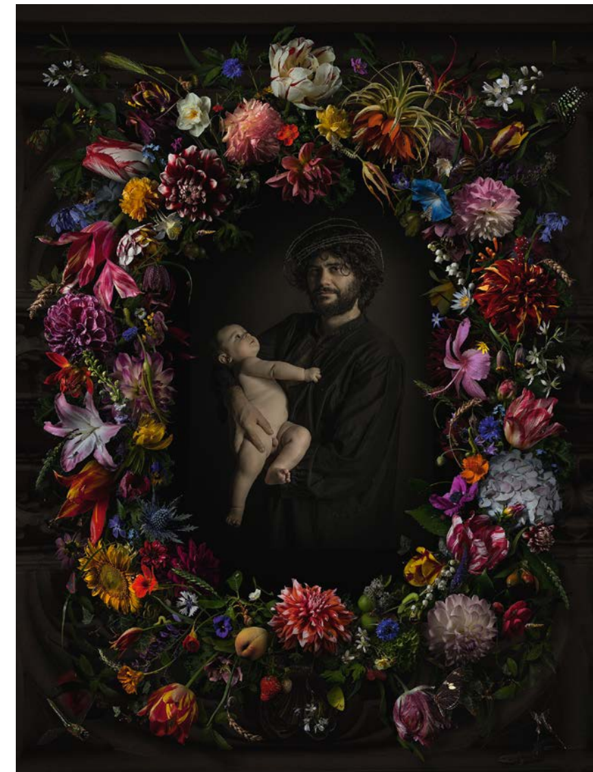
▲ Next generation , een co-productie van Bas Meeuws en Danielle van Zadelhoff. Deze zomer voor het eerst te zien in Gallery Heitsch in München. © DANIELLE VAN ZADELHOFF/ BAS MEEUWS.

fotografisch kunstwerk ter nagedachtenis van de slachtoffers van de ramp met de MH17. Zijn foto's intrigeren als bloemstillevens uit de zeventiende eeuwse schilderkunst. De schoonheid van de scherp gestoken bloemen, de lichtval en de kleuren zorgen voor een hoge mate van indringendheid. Zoals de oude meesters een voorbeeldboek gebruikten voor hun bloemstukken, zo heeft Meeuws zijn eigen digitale tulpenboek. Het in zeven jaar opgebouwde archief telt zo'n zeventuizend foto's van afzonderlijke bloemen. Stuk voor stuk gefotografeerd onder gelijke omstandigheden, meestal met het licht van linksboven. Achteraf arrangeert Meeuws de foto's tot een bijzonder, niet-bestaand boek. Alles