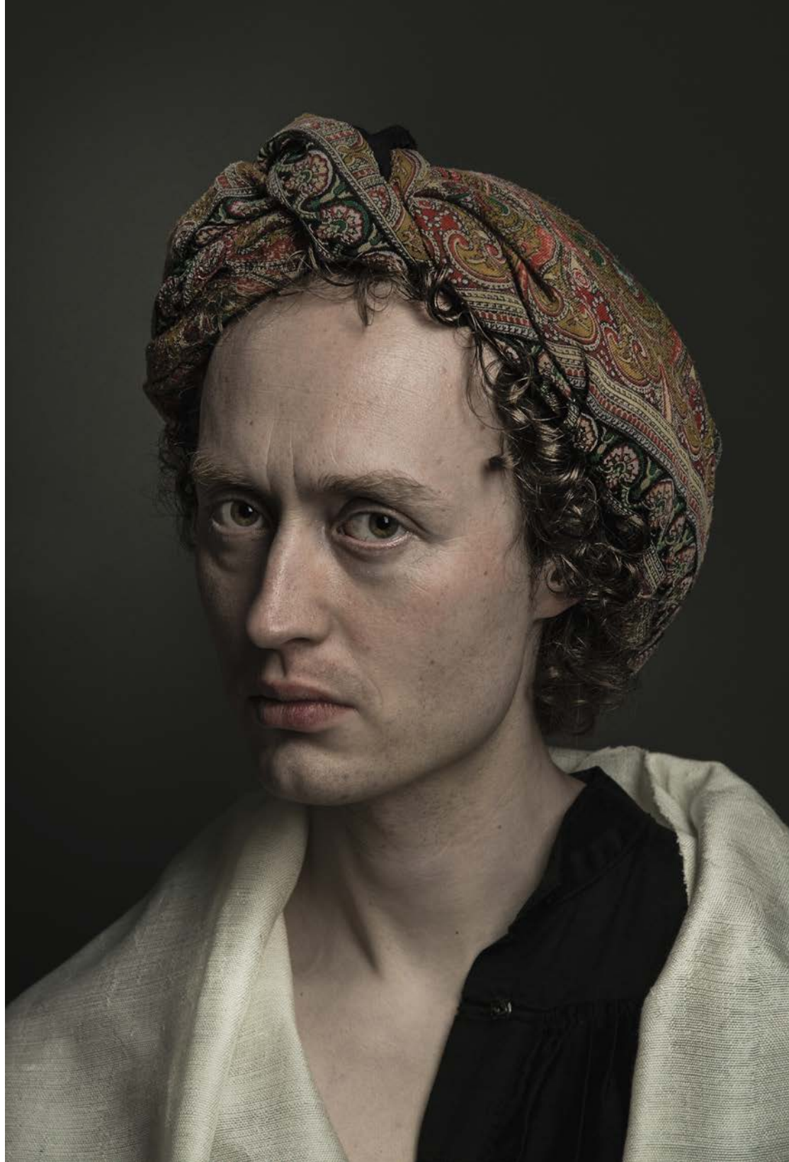
▲ Mystery . Fotograaf Danielle van Zadelhoff gebruikt lichttechnieken uit de Renaissance (= Caravaggio-achtig portret).

Naast de amateurfotografie en de fotojournalistiek is de ontwikkeling van de fotografie als autonome kunstvorm een van de belangrijkste mijlpalen van de laatste honderd jaar. Met de overgang naar de eenentwintigste eeuw moet de multimedia in dat rijtje