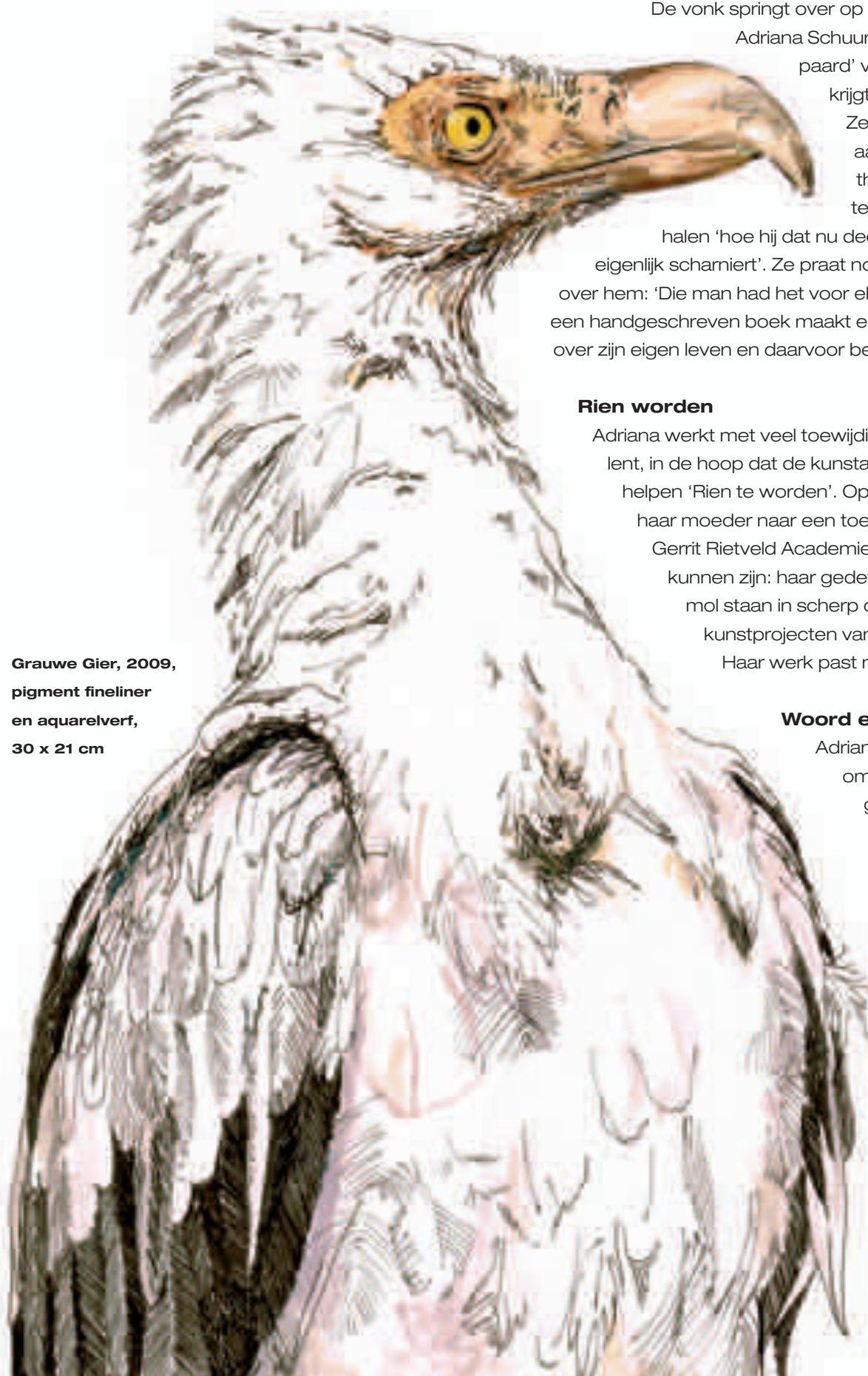
Grauwe Gier, 2009, pigment fineliner en aquarelverf, 30 x 21 cm