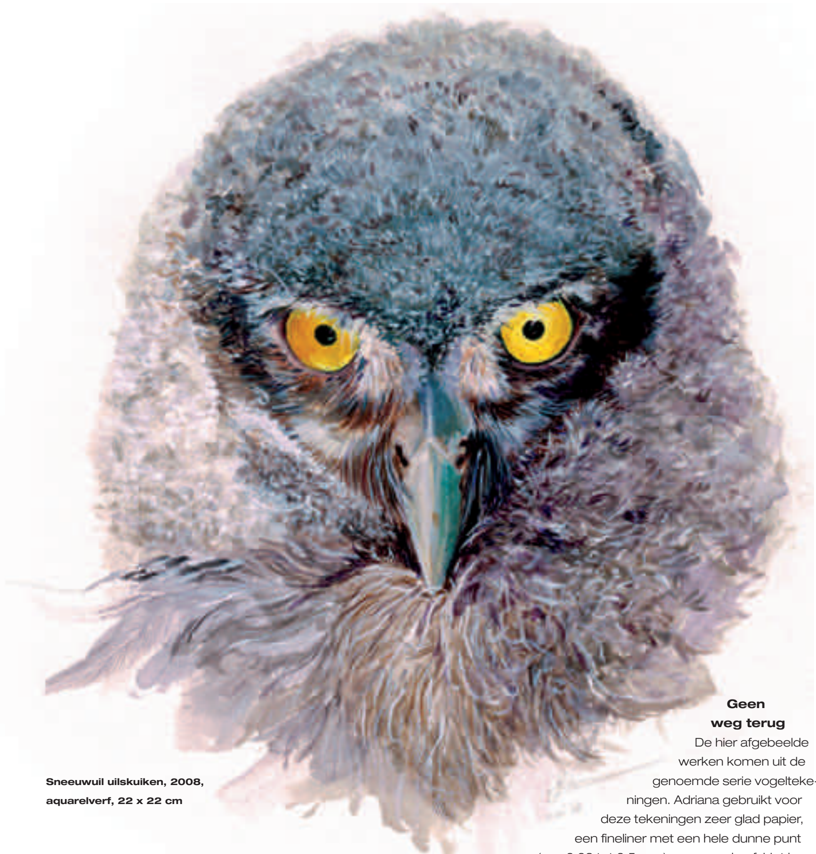
Sneeuwuil uilskuiken, 2008, aquarelverf, 22 x 22 cm

randen, dan is er ook een grote losheid. De techniek speelt hierin een grote rol. Ik ben altijd aan het uitvogelen hoe ik dat wat ik zie het beste kan vertalen naar lijnen, krassen, textuur en kleur.'