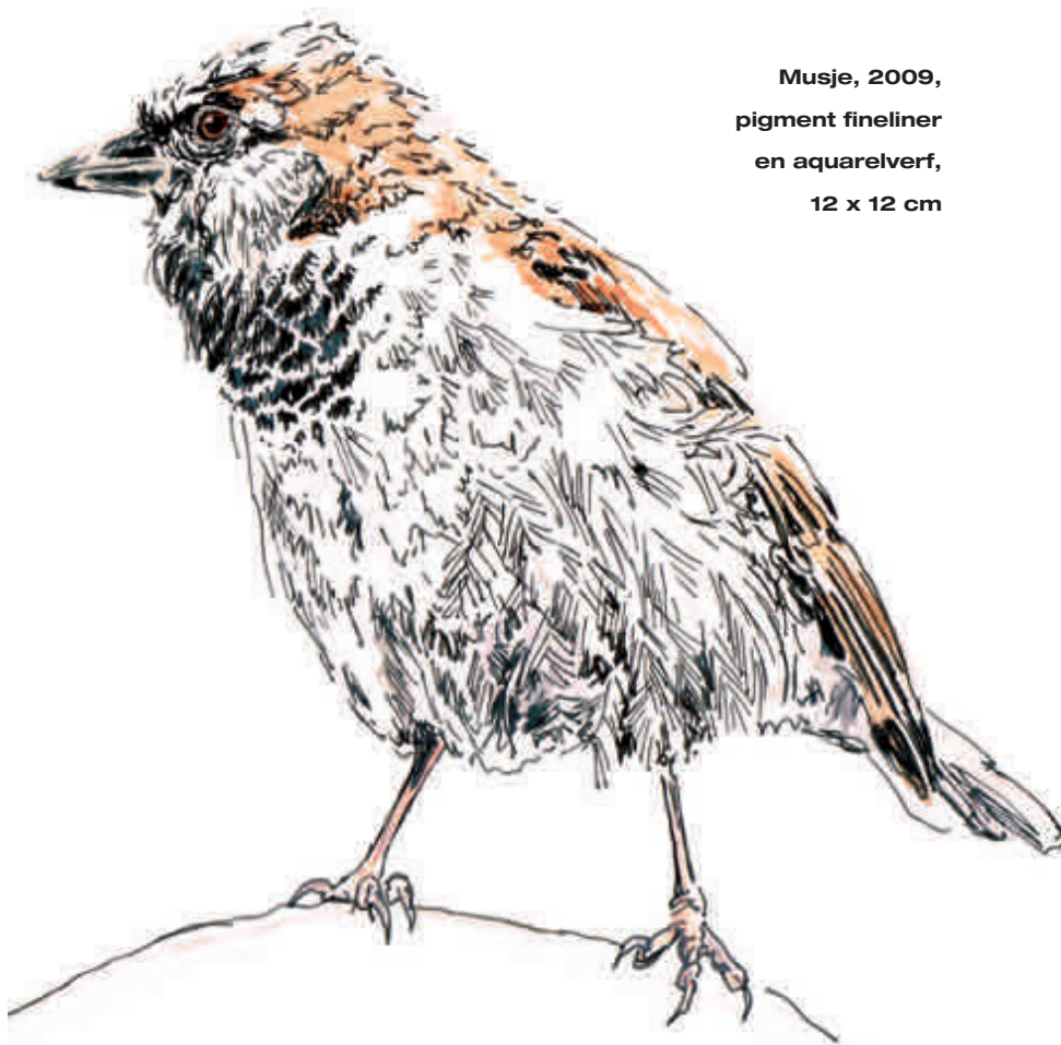
Musje, 2009, pigment fineliner en aquarelverf, 12 x 12 cm