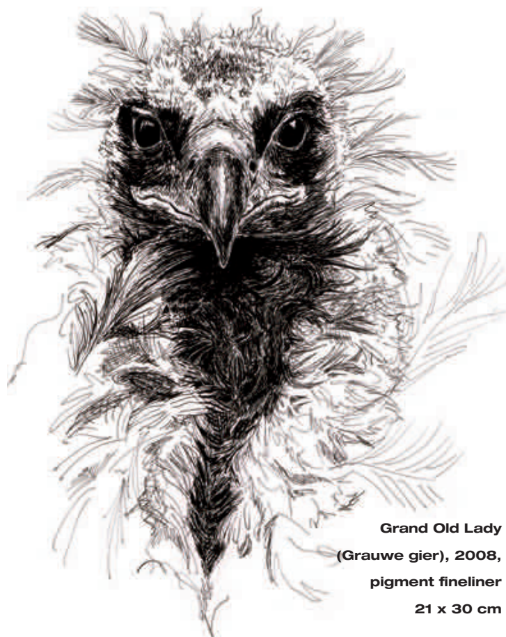
Grand Old Lady (Grauwe gier), 2008, pigment fineliner 21 x 30 cm