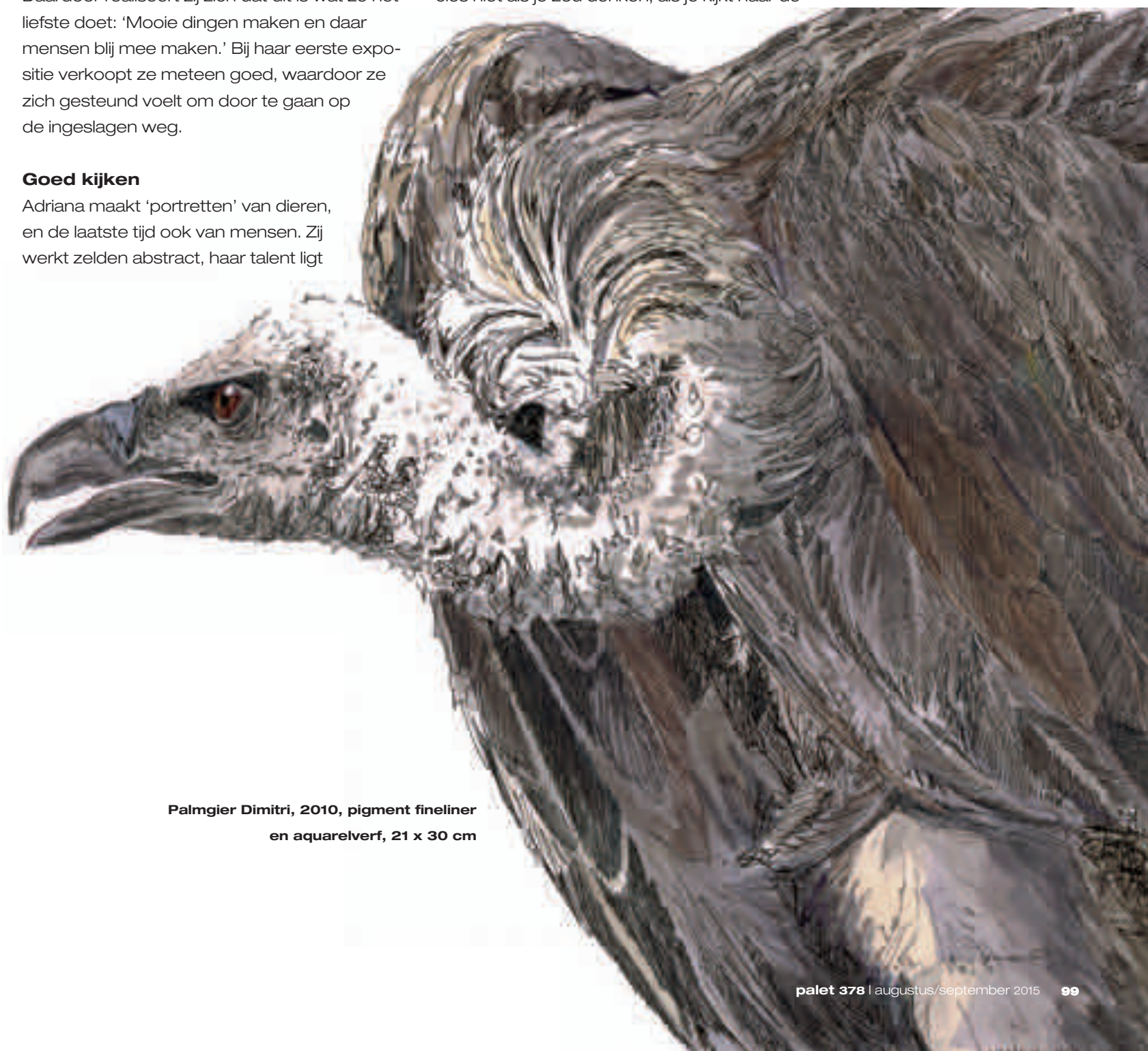
Palmgier Dimitri, 2010, pigment fineliner en aquarelverf, 21 x 30 cm

In de vertaalslag van een foto naar een tekening richt Adriana zich op wat haar letterlijk aanspreekt in het plaatje: veelal een karakteristieke houding of blik. Dan volgt het omzetten daarvan in grafische elementen. 'Ik versterk wat ik in die foto zie. Daarbij stuur ik het kijken van de toeschouwer. Mijn tekeningen zijn lang zo precies niet als je zou denken, als je kijkt naar de