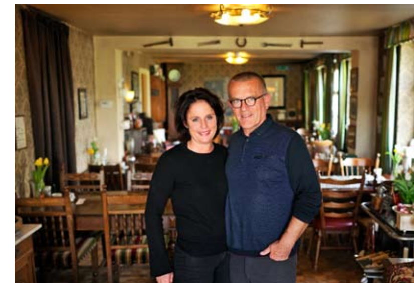
De eigenaren van Hotel Herberg de Smidse; in het voorjaar maakt het ontluikend groen Epen tot een paradijs.