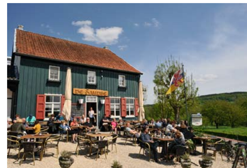
Epen kent vele wandelroutes en uitdagingen voor de sportieve fietser; genieten van de zon en een lekker drankje.

de kerk ligt. “We zien dan ook dat veel kerkgangers na afloop van de dienst nog even naar het graf van hun geliefde lopen en daar een kaarsje branden”, aldus Van den Berg. Begraven heeft hier nog steeds de voorkeur boven cremieren. “In de Randstad liggen die cijfers heel anders”, weet hij. De kerk speelt een grote rol in de Epense gemeenschap die hij als ‘hecht’ omschrijft, met een zeer rijk verenigingsleven. Iedere laatste zondag van augustus wordt de sacramentsprocessie gehouden waar niet >