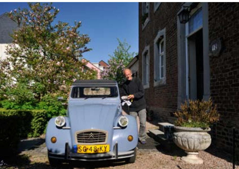
Meneer pastoor bezoekt zijn parochies in zijn trouwe 2CV.