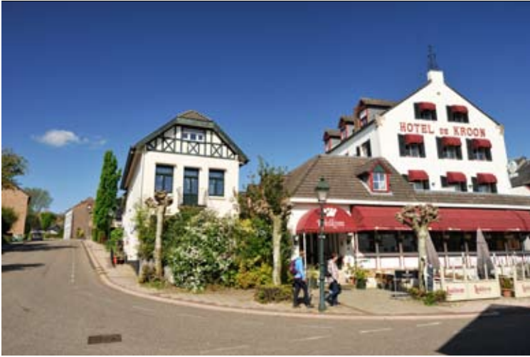
Hotel de Kroon in Epen.

alleen Epenaren naartoe komen, maar gelovigen uit het hele land. Ook Allerheiligen, de zondag rond 1 november, mag rekenen op aandacht van veel gelovigen.