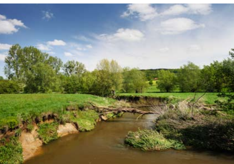
Een aantrekkelijk logeeraadres in Epen; dit kleine stroompje heeft in eeuwen tijd de 'Dutch mountains' gemaakt.

De Geul – de snelststromende rivier van Nederland – heeft in Zuid-Limburg een groot dal uitgesleten waarin Epen ligt.