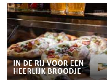
IN DE RIJ VOOR EEN HEERLIJK BROODJE

'Het magische uur', het uur vlak voor zonsopgang of het uur na zonsopgang waarin vaak de mooiste kleuren in de lucht te zien zijn. Het magische licht heeft op verschillende manieren vele kunstenaars hartten geraakt en hen geïnspireerd tot bijzondere werken. En het is dit jaar het thema van de alweer twintigste Vijfhoekroute.