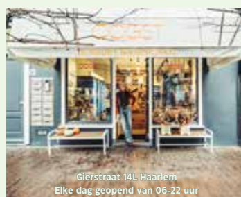
Gierstraat 14L Haarlem Elke dag geopend van 06-22 uur

De nieuwe boerenwinkel bij jou in de buurt. Kom je langs? Download dan eerst de Oogst-app in je app-store. Tot snel!