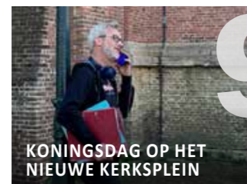
KONINGSDAG OP HET NIEUWE KERKSPLEIN