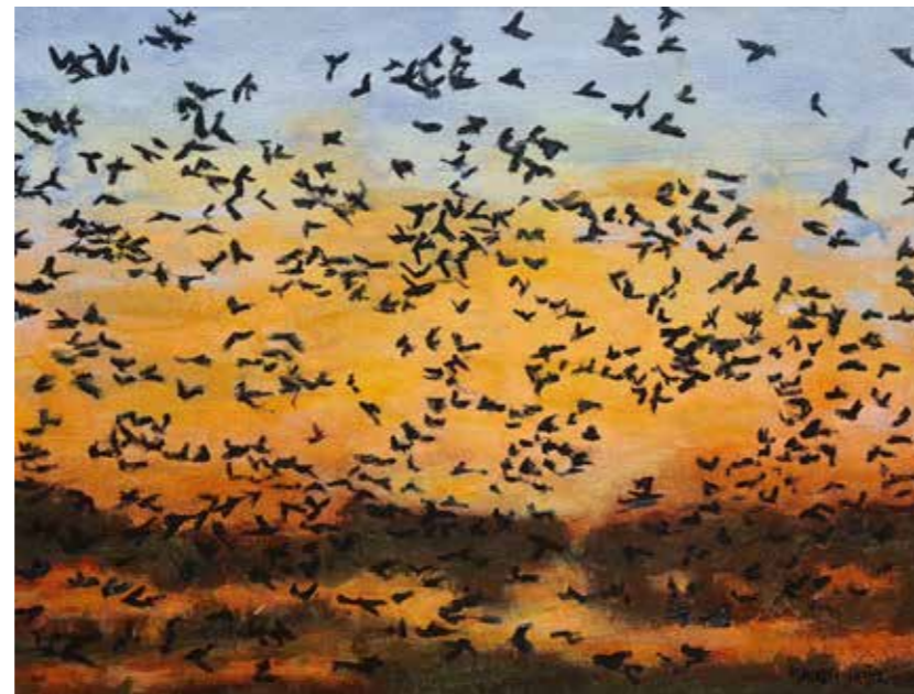
Maureen Meijer: "Het magische uur, alles om mij heen verdwijnt, eventjes neemt het mij mee, naar een warme, betoverende wereld"