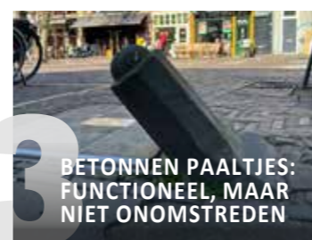
BETONNEN PAALTJES: FUNCTIONEEL, MAAR NIET ONOMSTREDEN