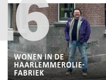
WONEN IN DE HAARLEMMEROLIE-FABRIEK