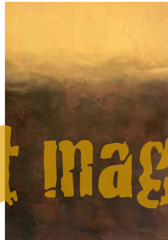
Marianne Blijdestein: "Het licht! Het licht dat alle lijnen zoel en alle contouren zacht maakt."