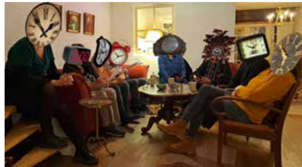
Het Magische Uur bij de organisatie...

Op 17 en 18 mei 2025 verandert onze Vijfhoek opnieuw in een bruisend kunstwalhalla tijdens de 18e editie van de Vijfhoek KunstRoute. Wat ooit begon als een rebelse tegenhanger van de strikte Kunstlijn, is in twintig jaar uitgegroeid tot een warm en verbindend kunstfestival waarin kunstenaars, buurtbewoners, kunstliefhebbers, ondernemers, winkeliers en horeca elkaar ontmoeten.