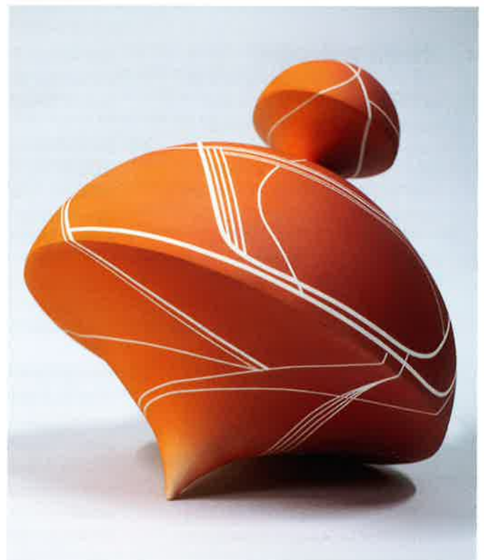
Nanda Verhaegh, Take a turn , 2025; porselein 1.200 °C; h. 26 x 22 x 22 cm. Met dit werk won Nanda Verhaegh de derde prijs in de jubileumwedstrijd KLEI in beweging 2025