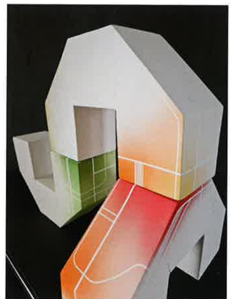
Nanda Verhaegh, Events , 2022; porselein 1.150 °C; h. 37 x 20 x 20 cm