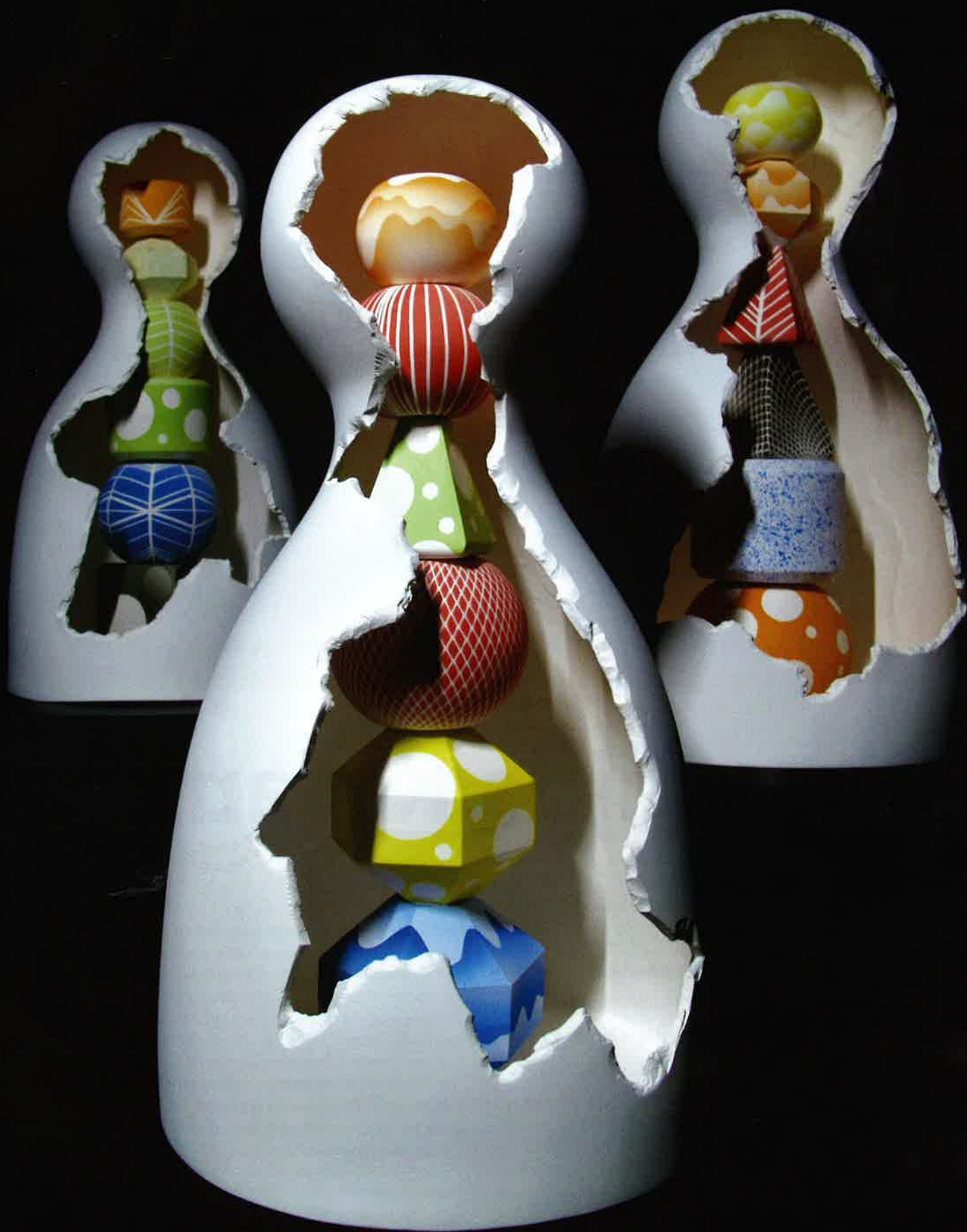
Nanda Verhaegh, onderdelen Growing into Myself , 2024, porselein 1.180 °C, h. 16 x 24 x 8 cm