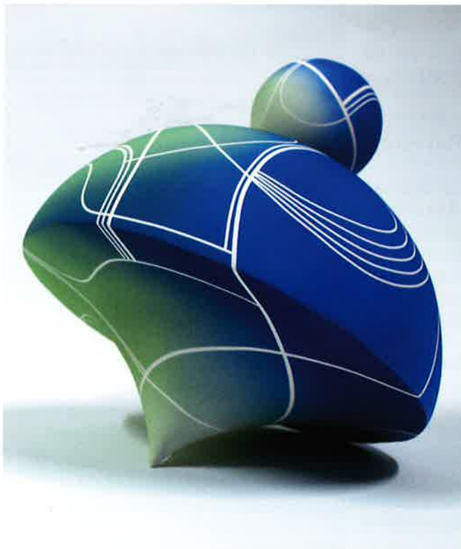
Nanda Verhaegh, Take a turn (blauwe versie), 2026; porselein 1.200 °C; h. 26 x 22 x 22 cm

van een mal, die uit vijf delen bestaat. Daarna kwam de echte uitdaging: wat was de juiste hoeveelheid gietporselijn, hoe lang moest ze het materiaal laten drogen in de mal, en ook, in welke richting zou ze de vorm in de mal laten drogen met de grootste kans op succes - horizontaal, verticaal, zijwaarts, op de kop?