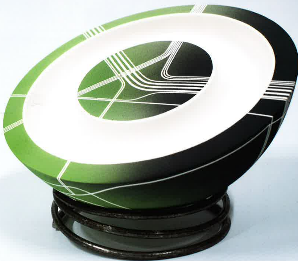
Nanda Verhaegh, boven: Bowl (oranje versie), 2025; porselein 1.200 °C; h. 10 x 20 x 20 cm | onder: Bowl (groene/zwarte versie), 2023; porselein 1.200 °C; h. 10 x 20 x 20 cm